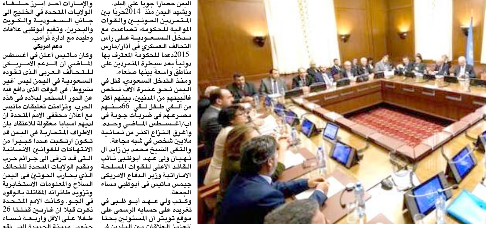
اجتماع: جانب من اجتماع جينيف بشأن الأزمة اليمنية

لم تتمكن من إقناع... وقد صنعاء بالقدوم إلى هنا. لم تنجح بذلك بكل بساطة، مضيفاً أنه لا يزال من المبكر جدا القول متى ستعقد المشاورات المقبلة. وغادر وفد الحكومة اليمنية جينيف السبت بعد تعذر إجراء محادثات برعاية الأمم المتحدة المحادثات التي تتم بإشراف ممثل الأمم المتحدة الخاص إلى اليمن مارتن غريفيث، الأولى منذ فشل عملية طويلة للسلام في العام 2016 بهدف وضع حد للنزاع الذي أغرق اليمن في أسوأ أزمة إنسانية في العالم. لكن الحوثيين الذين يسيطرون على مساحات واسعة من أراضي اليمن من بينها صنعاء، ظلوا في العاصمة بحجة عدم حصولهم على ضمانات كافية للتوجه إلى جينيف. تحالف عسكري وكانوا يطالبون خصوصاً بضمان عودتهم إلى صنعاء بعد المحادثات ان يفرض التحالف العسكري في اليمن حصراً جويًا على البلد. ويشهد اليمن منذ 2014 حرباً بين المتمردين الحوثيين والقوات الموالية للحكومة، تصاعدت مع تدخل السعودية على رأس التحالف العسكري في آذار/مارس 2015 بدعم من الحكومة المعترف بها دولياً بعد سيطرة المتمردين على مناطق واسعة بينها صنعاء. ومنذ التدخل السعودي، قتل في اليمن نحو عشرة آلاف شخص غالبية من المدنيين، بينهم أكثر من ألفي طفل لقى 666 منهم مصرعهم في ضربات جوية في اب/أغسطس الماضي وحده. وأغرق النزاع أكثر من ثمانية ملايين شخص في شبه جاعة. والتقى الشيخ محمد من زايد ال نهبان ولي عهد أبوظبي نائب القائد الأعلى للقوات المسلحة الإماراتية وزير الدفاع الأميركي جيمس ماتيس في أبوظبي مساء الجمعة. وكتب ولي عهد أبوظبي في الجور. وكانت الأمم المتحدة تغردية على حسابها الرسمي على موقع تويتر أن المسؤولين بحثوا تعزيز العلاقات بين البلدين في المجالات الدفاعية والعسكرية تحت سيطرة الحوثيين.