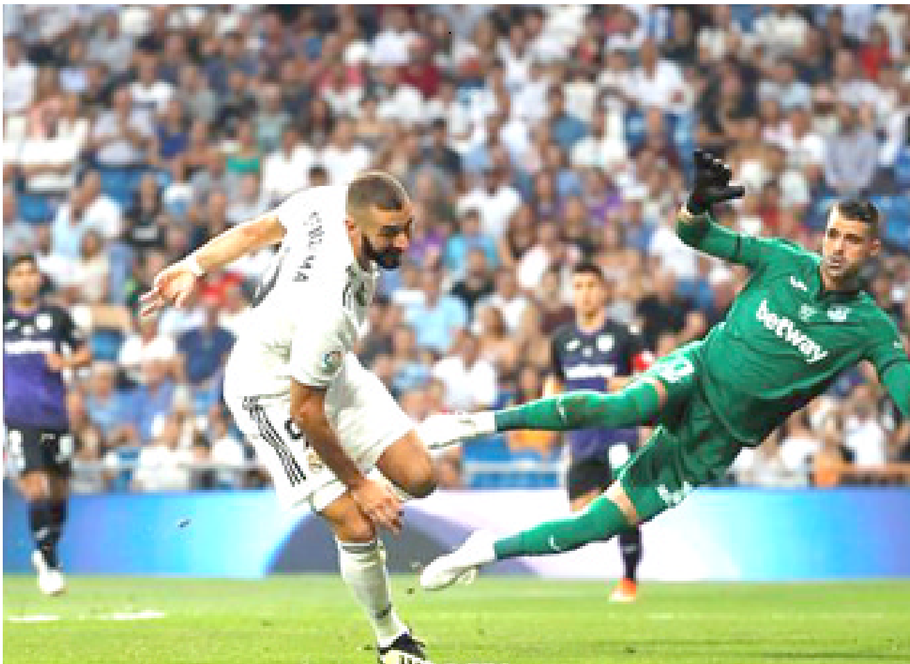
فوز: حقق فريق ريال مدريد فوزاً مثمراً على ليجانيس في الليغا

□ مدن - وكالات: واصل ريال مدريد، انطلاقته المميزة في بطولة الدوري الإسباني، بتغلبه على ضيفه ليجانيس، بنتيجة (4-1)، مساء أول أمس السبت، في إطار الجولة الثالثة من عمر الليجا. افتتح جاريث بيل، التسجيل لريال مدريد في الدقيقة 14، وتعادل جويدو كاربيو لليجانيس من ركلة جزاء في الدقيقة 24. وسجل كريم