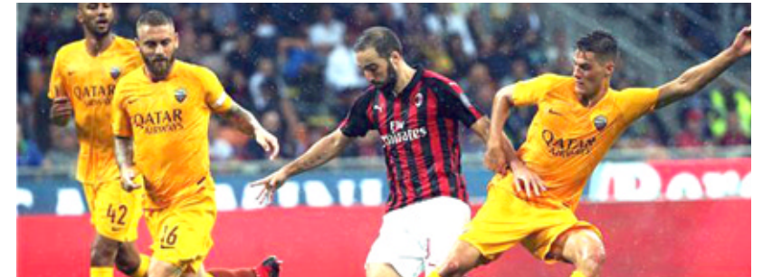
جانب من إحدى مباريات الدوري الإيطالي

سبورت، أن جماهير روما، قامت بتعليق بعض لافتات بالمدينة عقب نهاية المباراة قالت فيها: لكن ما هو الإسكوديتو؟ ما هو دوري الإيطالي؟ بطولاتكم هي جمع الأموال والمبيعات والأرباح.