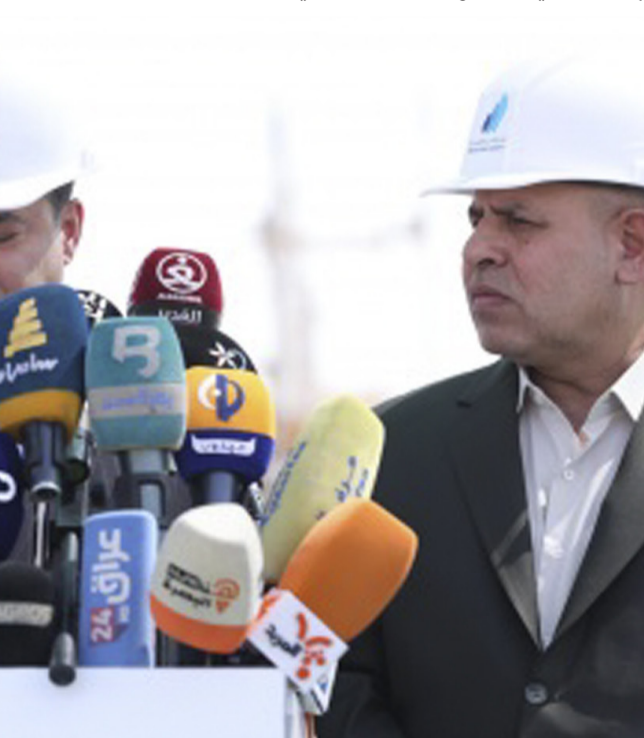
مؤتمراً: مسؤولو النفط في مؤتمر صحفي

بغداد - البصرة - البصرة - البصرة أفادت وزارة النفط، بارتفاع معدلات تصدير الغاز السائل والمكثفات التي بلغت حاليا نحو 50 ألف طن، فيما