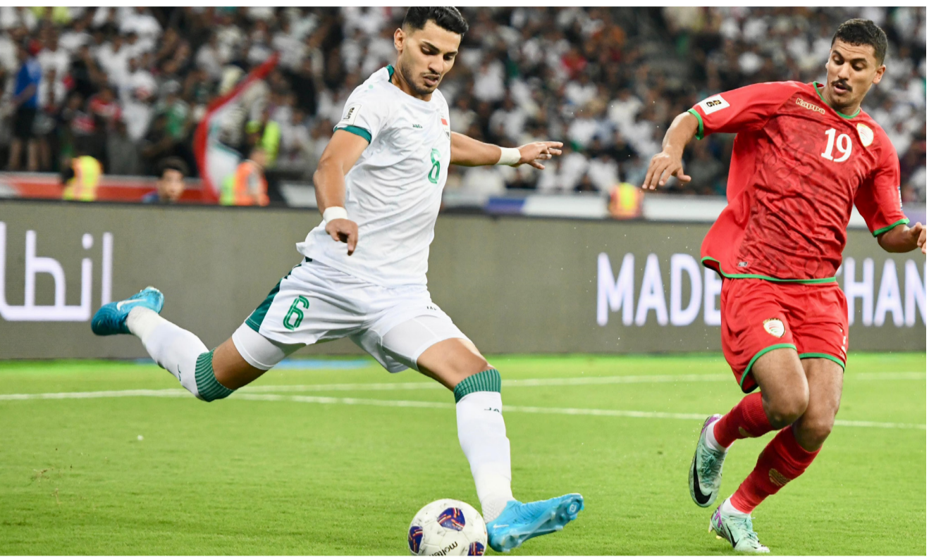
فوز: المنتخب الوطني يخطف العلامة الكاملة من عمان على أرض البصرة