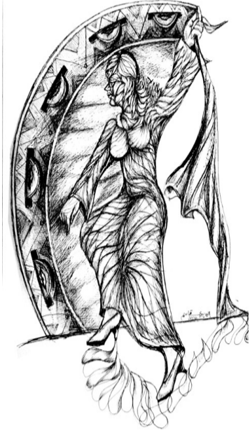
كنت انتظرتك لو اخبرتني زمناً لكن تقدمت حتى ملئ الملأ تلك الرسائل لم تبلغ نهايتها لكن ظلي ليمها بينها اول لكنما ايقظت قلبي بعد ميتته

هذا لعمرك جدّ بؤده هُزَلْ ماذا تريد به؟ لا ثوب يسترّه عار كما الريح إلا أنه عَجَلْ الباب دونك بحر، لو دنوت له الرياء على كفيه يكتحل لا وجه لى، وطنى وجه لقاتله حتى المرايا اضعاعنى، واكتمل ابصرته فيك حد اللعن يشبهنى كانه فيك من اثوابه نذل ولا يد كلما مُدت تسالفتنى هل "بعد" ذا لك غادرته "قبل"، ولا اجيب، ستيكبي غرابتها ولا سواله، وانت الان تنخذل **** ياويح بغداد اقصنتي نعالها وغرقتني، ووجهي دونها نول وباعدت حد ان ابقت اصابعها ماين عيني حد العمى تسعل لم تبق لي طيقا فيها على طبق كانت بجهاث الارض ارتحل ياويح نفسي على نفسي وواعجبا باننى بين جلدي غربة ازل حتى التغرُّب والاثواب رايت تسل على فما تفك تعزّل قالوا "تكرتت" قلت الله ارسلني فيها غريبا، ولما تنطق الرسل ولست اعمى، وهذا الماء يقراني فيه السلام وتلك خطوه الحجل نسر تصعد في اقصى السماء بها فكن بها جنبا يا ابيها الجبل