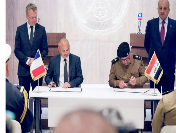
عقد : العراق وفرنسا يوقعان عقد شراء طائرات كاراكال

الحفاظات - مراسلو (الزمان) وقعت وزارة الدفاع العراقية، عقداً مع شركة إيرباص الفرنسية لشراء طائرة كاراكال، في إطار تعزيز القدرة التشغيلية لمواجهة التحديات الأمنية المتزايدة وتعزيز الأمن الوطني، وقال الوزير ثابت العباسي خلال مؤتمر مشترك مع السفير الفرنسي لدى بغداد باتريك دوريل أمس إن (الوزارة) مستمرة بتوقيع العقود مع الشركات الرصينة من أجل رفع قدرات الجيش العراقي، مشيراً إلى (إن طائرة كاراكال من الطائرات المقدمة، نظراً لتعدد مهامها)، مؤكداً إن (قادتنا في الجيش لديها تجربة في استخدام هذه الطائرة نتيجة مشاركة فرنسا في التحالف الدولي المناهض لداعش)، وأضاف (مقيلون على عقود ترفع من قدرات الجيش العراقي، ولأسباباً أننا ننقل الدعم الكامل من الحكومة الاتحادية)، من جانبه، قال السفير باتريك دوريل إن (هذا العقد هو خطوة حاسمة للقاءات والتعاون المستمر التي جمعت رئيس الوزراء محمد شياع السوداني بالرئيس الفرنسي إيمانويل