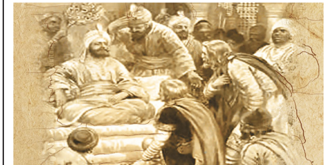
شعراء في مجلس السلطان

لم يرتضوها لأنفسهم فنأوا عنها بحجة أو باخرى، وبعض منهم اتصلوا من قاصدهم في زمن لاحق. وانصافا، فإن شعراء البيت الأبيض لم يجربوا خطيئة تجديد الحاكم ووصفه بما يميزه عن البشري، لأن شعر المناسبات، على مديحه والإشادة به فطلب كما تقول شاعرة أوباما إليزابيث الكسندر «مناقض لطبيعة الشاعر، الغزل والحب، وبالفعل أشد بعض الشعراء في حضرته قاصد في هذا الضرب من الشعر، وقد رأى عديد من شعراء تلك المرحلة في طقس الشعر هذا حالة تملق وانتهازية هي.