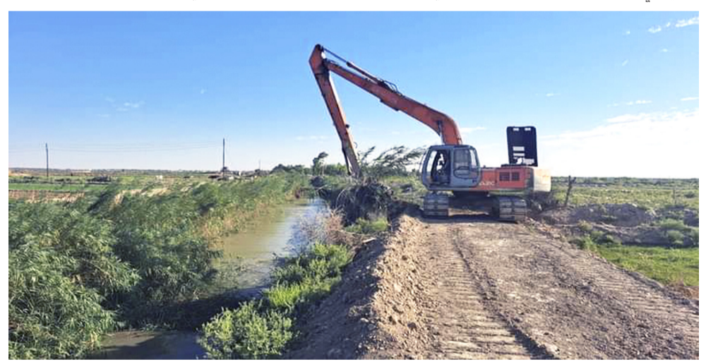
إصلاح : آليات الموارد المائية تصلح اراضي