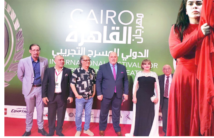
مهرجان : لقطات من فعاليات مهرجان القاهرة الدولي للمسرح التجريبي