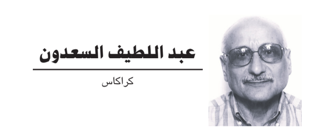
عبد المظيف السعيدون

أخر رئيس «ديمقراطي» اختار في حفل تنصيبه إليزابيث الكسندر لتكون شاعرنه، رغم أنها لم تكن معروفة على نطاق واسع حتى عند مواطنيها الأميركيين، هي الأخرى تغنت بامجاد أميركا وتاريخها، «لنغن باسماء من ماتوا كي نجئ الى هنا، هم الذين قادوا عربات القطار، واقاموا الجسور، وطقفوا نثار القطن، وبنوا حجرا فوق حجر الصروح المتلائلة بالضوء، فلنغن تمجيذا لكفاحهم، ولكل علامة نقشتها بد عملة». رئيس جديد استوقفتني في قصائد التنصيب أنها لم تحسو تمجيذا للرئيس الجديد، أو حتى إشارة مباشرة أو غير مباشرة له، وفي ذهني ما عهدناه، نحن العرب، في أشعارنا حين نقف في حضرة الحاكم في مناسبات كهذه لتندفق عليه كل ما يتراءى لنا من صفات تميزه عنا وعن بقية البشر، المتبني وصف سيف الدولة بأنه «حسام الملك ولواء الدين وابو الهيجا وشمس حسين أكثر حاكم في عصرنا حصل على قصائد مدح واطراء قيلت في