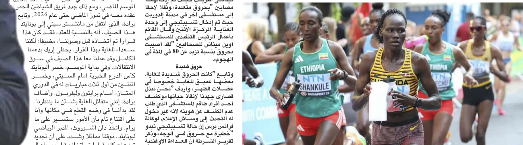
العداءة الأوغندية ريبكا تشيبينجي

□ نيروبي - (ا ف ب) - دخلت عداءة أولمبية أوغندية العناية المركزة في كينيا بعد إصابتها بحروق بنسبة 80 في المئة بعد أن صبت صدفيها عليها البنزين وأضرم فيها النار في حادثة مأساوية أخرى قاصمة على العنف الاجتماعي