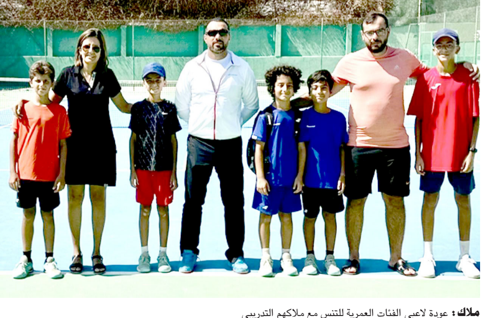
ملك: عودة لاعبي الفئات العمرية للتنس مع ملاكمهم التدريبي