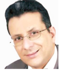
عبد الحق بن رحمون كاتب مغربي