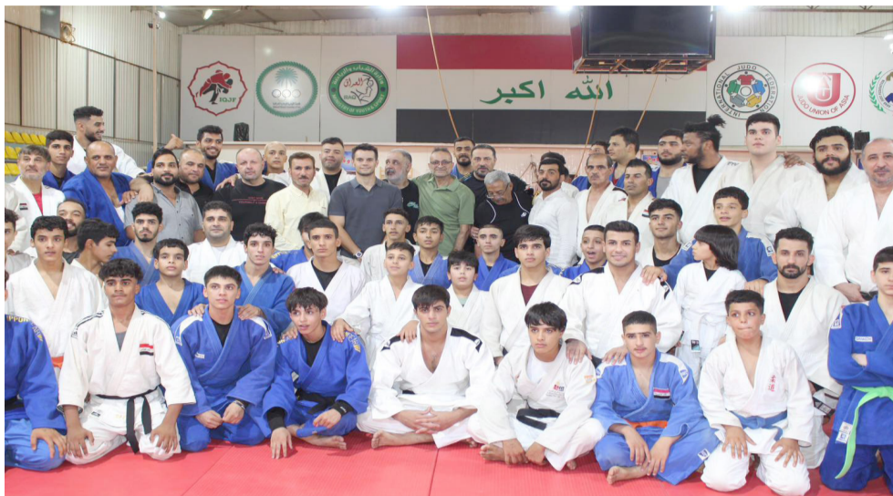
لجنة: زيارة اللجنة الأولمبية الى اتحاد الجودو