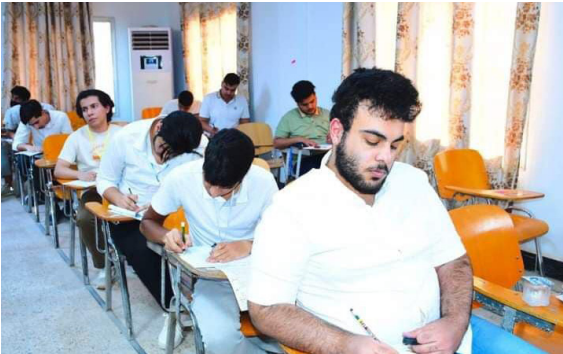
إمتحانات : طلبة يؤدون امتحانات الدور الثاني للدراسة الاعداية