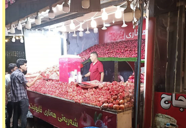
جانب من الجولات في السليمانية

70 كم يبعد مصيف دوكان عن مركز مدينة السليمانية توجهنا إليه ظهرا للتمتع بمنظر المياه المندفقة من فتحة سد دوكان ولتناول وجبة سمك لذينة يقترّب مذاقها من سمك البحر وتحصل نكهة السمك المسكوف، كثرة الكرويات السياحية في السليمانية جعلتنا ننتظر بعض الوقت للحصول على طاولة لتناول وجبة السمك.