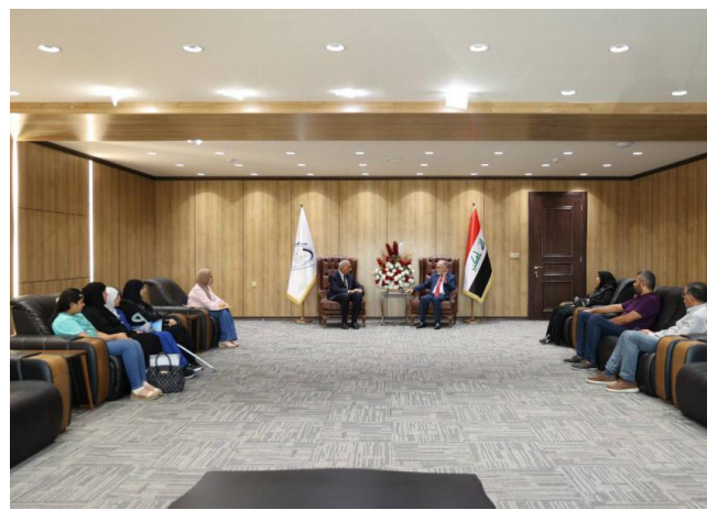
استقبال: محافظ بغداد يستقبل عوائل شهداء الكرادة