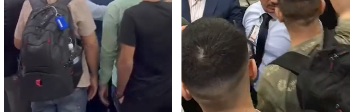
فوضى : جانب من الفوضى والتخبط الذي شهدته صالات مطار بغداد الدولي أمس

ملحوظة في رحلات المسافرين، وهو ما يثير استياء العديد من الركاب ويؤثر سلباً على تجربة السفر مما أدى إلى تراجع الثقة في الخطوط الجوية العراقية. وقال مسافرون إن هذه المشكلات المتكررة تجعل إجراءات السفر تجربة محبطة وغير مريحة)، وأضافوا أن (التأخيرات المستمرة تؤدي إلى تكبد الركاب وعدم الالتزام بالمواعيد التي تمنحها الخطوط الجوية)، وأكد المسافرون أن (الخطوط