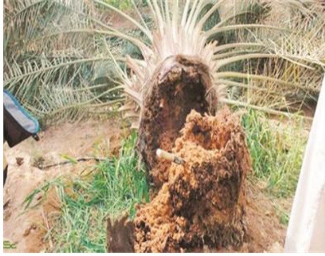
سوسة: نخلة مصابة بالسوسنة الحمراء

تشريحها وبالتالي خسرتها في كلتا الحالتين وأعلنت قائمقامية قضاء مندلي في محافظة ديالى ، عن شبح الجفاف في عدد من مناطقها ، مشيراً الى انها تأمل بامطار مبكر من أجل اسعافها . وقال قائمقام قضاء مندلي وكالة مازن أكرم لـ (الزمن) أمس، إن (مندلي أكبر وأشهر مدن الحدود شرق العراق، تعتمد بنسبة تصل الى 80 بالمئة على