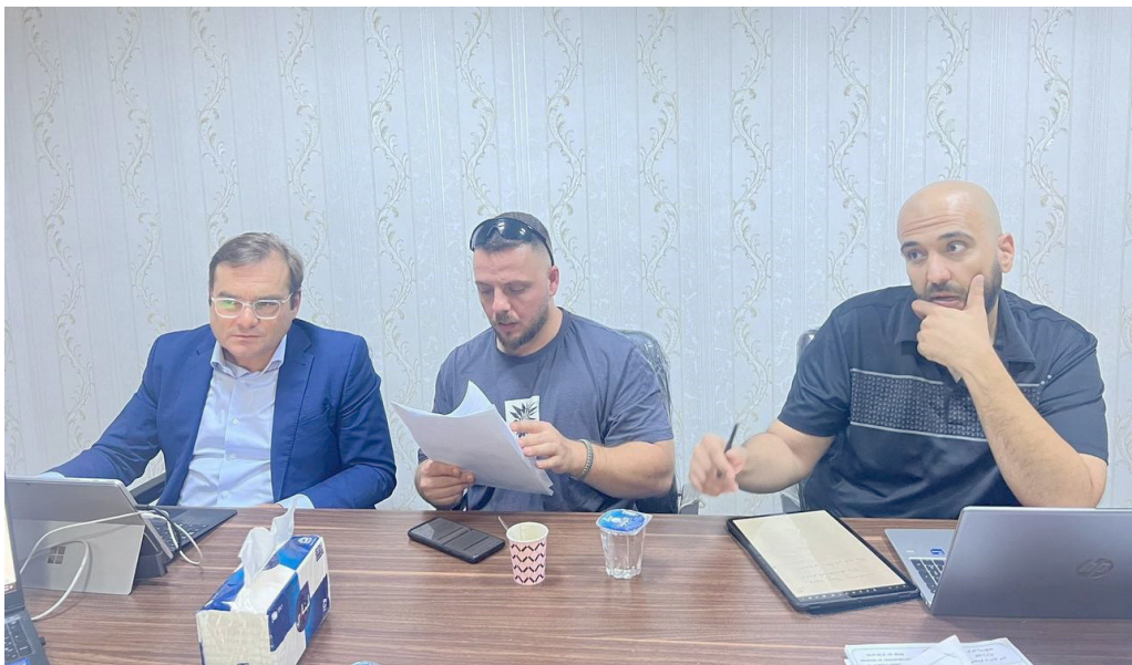
اجتماع لجنة التراخيص لنادي الفار في الممتاز مع الصالات

أقيم في ملعب الفيحاء بتعدادها بهدف كرسنتان وستتوجه اللجنة إلى بقية فرق المحافظات الأخرى في منطقتي الفرات الأوسط والجنوب التي لم تتم زيارتها حتى الآن. وكان الاتحاد العراقي لكرة القدم قد حدد العاشر من الشهر المقبل موعداً لافتتاح دوري نجوم العراق للموسم الثاني بمشاركة 20 فريقاً (الشرطة، الجوية، الزوراء، النجف، زاخو، دهوك، نوروز، الطلبة، الحصاد، نغص ميسان، النفط، الميناء، الكهرباء، اربيل، الكرخ، كربلاء، نفط البصرة، القاسم، بديالي، الكرم). وتتوقف مشاركة الفرق على تصاريح لجنة التراخيص.