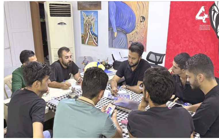
مهرجان : كواليس الاستعداد لمهرجان كركوك المسرحي الرابع