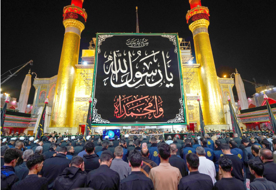
رؤية : العتبة العلوية المطهرة ترفع راية الحزن