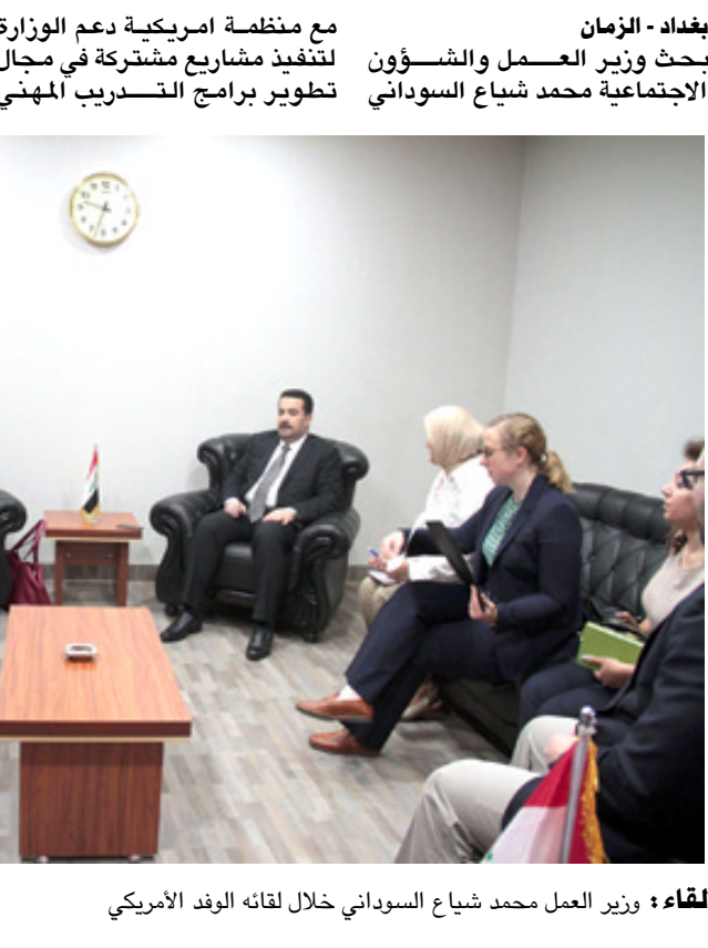
لقاء وزير العمل محمد شياح السوداني خلال لقائه الوفد الأمريكي

مع منظمة امريكية دعم الوزارة لتنفيذ مشاريع مشتركة في مجال تطوير برامج التدريب المهني الاجتماعية محمد شياح السوداني