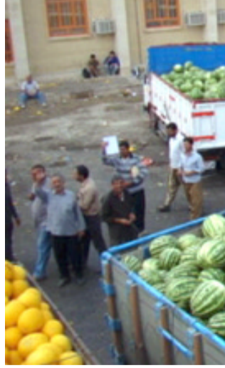
محاصيل : شاحنات تنقل الرقي والبطيخ تنتظر في ساحة عرض المحاصيل في التاجي

كما أعلنت بعثة الحج العراقية زيادة عدد الحجاج الذين وصلوا الى الديار المقدسة الى اكثر من 24 ألفا، فيما تستكمل جميع رحلات الحجاج من ذوي الشهداء خلال الاسبوع الجاري. وقالت الهيئة في بيان تلقته(الزمان) امس ان(عدد الحجاج الموجودين بالديار المقدسة بلغ 24 الف و25 حاجا منهم 14 الف و853 حاجا بالمدينة المنورة وتسعة آلاف و172 حاجا بكة المكرمة)، موضحة ان الحجاج المقدسة لآداء فريضة رحلة جوية و352 حافلة(برا) من جهتها، أعلنت مؤسسة الشهداء استكمال جميع رحلات الحجاج من ذوي الشهداء خلال الاسبوع الجاري.وقالت في بيان امس انها تتابع (عملية تفويج الحجاج الى بيت الله الحرام لهذا العام، حيث تستمر رحلات التفويج لذوي الشهداء وحسب المواعيد المحددة، وبالتعاون بين المؤسسة وهيئة الحج والعمرة)، مضيفة ان (ثلاث رحلات غادرت جوا فجر امس السبت، وستغادر 3 رحلات جوا فجر الأحد). وافاد البيان (بإطلاق 12 حافلة برا فجر امس السبت من محافظة كربلاء المقدسة متوجهة الى بيت الله الحرام لآداء مناسك الحج)، مؤكدا ان (جميع رحلات حجاج ذوي الشهداء البرية والجوية ستكمل خلال هذا الاسبوع).