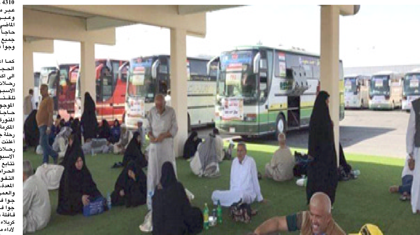
سفر : حجاج بيت الله الحرام المسافرين عبر المنفذ البري يأخذون إستراحة قبل دخولهم الأراضي السعودية