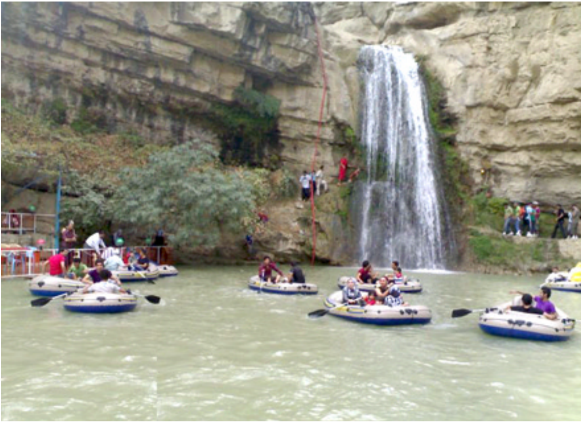
سياحة: مصطافون في مصيف باريل

إجازاتهم في إيطاليا أحوالاً جوية سيئة أينما توجهوا. ففي الشمال، لا تزال درجات الحرارة مرتفعة في حين يتوقع أن يشهد الجنوب طقساً عاصفاً. الأسبوع الماضي، نشرت رابطة ليغامبيني المدافعة عن البيئة تقريراً عن الأثار السلبية لوجات الحر كشفت فيه عن أن إقليم لاتسيو الذي يضم العاصمة روما شهد وفاة نحو 7700 شخص جراء موجات الحر منذ العام 2000. وتحسنت أحوال الطقس في السويد التي كانت خلال تموز الأكثر سخونة منذ أكثر من 250 عاماً مع هطول الأمطار في معظم أنحاء البلاد. وانخفضت درجات الحرارة لتعود إلى درجاتها المعتادة في الصيف إلى ما بين 20 إلى 25 درجة مئوية.