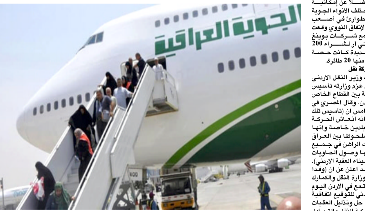
مغادرة: مسافرون عراقيون يغادرون طائرة عراقية

التعاون مع إيران في مجال تبادل السياح بين مدينتي مشهد المقدسة والنخف (الأنوف)، معلناً عن (استقبال 35 ألف زائر من محافظة خراسان خلال الزيارة الأربعينية هذا العام). وأكد أن المحافظة مستعدة لاستقبال ما يزيد عن 200 إلى 250 ألف زائر خلال الزيارة الأربعينية القادمة. وتسلمت إيران أمس الأحد خمس طائرات ركاب من نوع إيه تي ار وصلت بالفعل إلى العاصمة طهران. وهيملت هذه الطائرات الخمس في مطار مهر آباد الدولي بطهران ليبلغ عدد هذه الطائرات الإيطالية الصنع إلى 13 طائرة اشتريتها شركة الخطوط الجوية الإيرانية. وكانت الذيرة التنفيذية لشركة الخطوط الجوية الإيرانية قرزانه شرفيافي قد غادرت قبل أيام إلى فرنسا للقيام بإجراءات استلام الطائرات وإقلاعها باتجاه إيران عبر مطار تولوس الفرنسي. ونخل هذا الطراز من الطائرات الإيطالية مجال نقل الركاب عالمياً عام 2010 وهي طائرة مزودة بأحدث التقنيات وأنظمة الأمان والراحة وهي قادرة على قطع مسافة ألف و528 كيلومتراً في الساعة وتوسع لـ 70 ركاباً