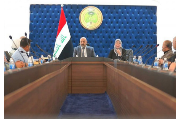
اجتماع : مسؤولو وزارة التربية خلال اجتماعهم مع أصحاب المطابع

بغداد - ندى شوكت تجاهلت وزارة التربية، عطلة أربيعينية الأسماء الحسين عليه السلام، والزمت المطابع بتسليم المناهج الدراسية في موعدها المحدد، فيما أشار القرار استثناء أصحاب المطابع وقالوا إن (الزمان) أمس إن (هذا القرار يثير القلق من تأخير هذا الإجراء على سير العمل وجدول التوزيع، وأضافوا أن (العطلة التي أعلنتها الحكومة في ما يخص الزيارة الأربيعينية، فضلاً عن تأخر وصول المستلزمات الخاصة بالطباعة جراء تأخرها بسير الزائرين إلى محافظة كربلاء، انعكست على قدرة المطابع للوفاء بالتزاماتها وفق الجدول المحدد). وشددوا على القول إن (هذا القرار قد يؤدي إلى ضغط كبير على العاملين وتحديات إضافية لضمان تسليم المناهج في الوقت المحدد، مما قد يعكس سلباً على جودة الطباعة والتوزيع، وكانت الوزارة قد كشفت عن تفاصيل اجتماع موسع عقد مع المطابع الحكومية والأهلية بشأن طباعة المناهج الدراسية بالكامل، بعد توجيه مديريات التربية بالاعتناء على الكتب المستترجة بنسبة 70 بالمائة في المرحلتين المتوسطة والإعدادية.