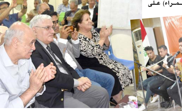
احتفالية: جانب من احتفالية الحزب الشيوعي العراقي بعيد صحافته