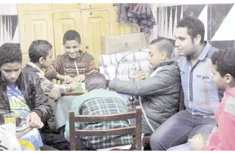
دورات للطلبة في مراكز شبابية