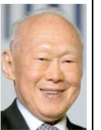
لي كوان يو

بغداد - دنيا الحسنى هكذا أسس ( لي كوان يو ) سنغافورة التي نعرفها اليوم بلداً متطوراً يرتقي بأقوى إقتصاد عالمي ، لم تكن سنغافورة سابقاً أكثر من مستعمرة بريطانية فقيرة الـوزراء قبيلها منذ عام 1959، وبعد الانتخابات الديمقراطية انضمت سنغافورة الى الاتحاد الماليزي عام 1965 عقب الاستقلال عن بريطانيا لكن بعد سنتين فقط قررت ماليزيا التخلي عنها، وأصبحت بعد ذلك سنغافورة دولة مستقلة ، بحكم الأمر الواقع.