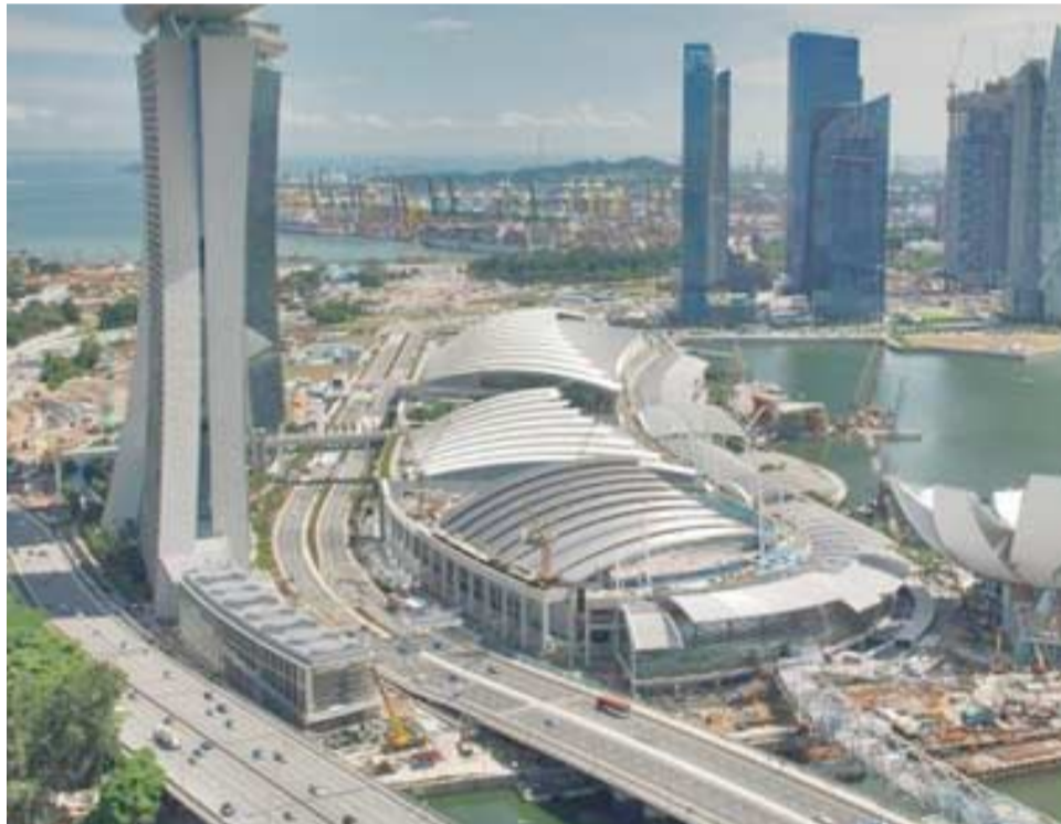
معايير: سنغافورة مدينة عصرية اليوم بكل المعايير

أكثر موانئ العالم ازدهاراً، وفي تلك الإناء أصبح عموم الشعب متعلماً، يتحدث اللغة الإنجليزية التي أصبحت لغة رسمية في البلاد، وبينما كانت سنغافورة تنفوق اقتصادياً، استطاعت حل مشكلة المنازل العشوائية