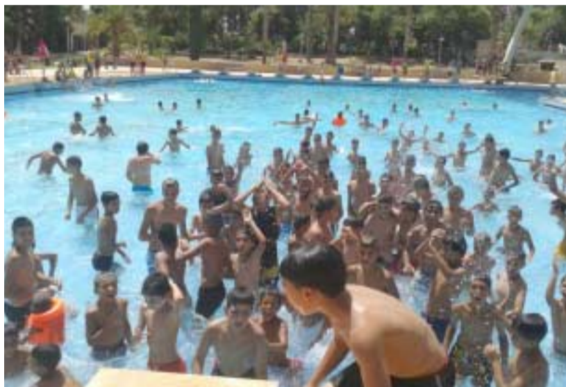
صبيّة في مسبح عمومي