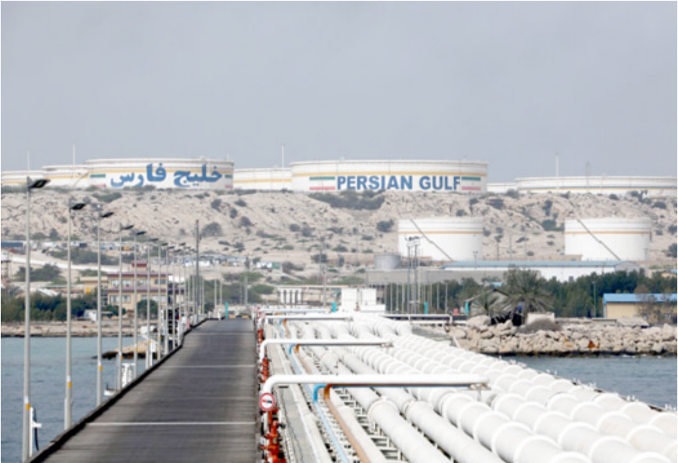
جزيرة: منشأة نفطية إيرانية في جزيرة الخليج العربي

مع زيارة يقوم بها الرئيس روحاني إلى أوروبا للحفاظ على الاتفاق حول النووي الإيراني الموقع عام 2015 بعد انسحاب الولايات المتحدة في أيار/مايو من هذا الاتفاق. ويعد سويسرا يومي الاثنين وامس الثلاثاء، سبتوجه روحاني إلى فيينا اليوم الأربعاء.