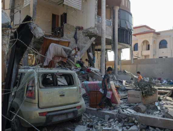
أنقرة - ماهر أوغلو قصف فلسطينيون يتفقدون منزلاً بعد تعرضه لقصف إسرائيلي

استئناف رحلاتها بين باريس شارل ديغول وبيروت المعلقة منذ 29 تموز ابتداء من اليوم (الخميس)، وأضاف إن (القران) ينطلق أيضاً على ترانسافيا فرنساً). وكانت إير فرانس قد أكدت (استمرار العمليات سيظل خاضعاً لتقييم يومي للوضع محلياً)، مذكراً بأن (سلامة زبائننا وأطقمها أولويتنا المطلقة)، وأضافت أن (إجراءات المرونة التجارية المعمول بها لا تزال سارية، ما يسمح للزبائن الذين حجزوا رحلات من وإلى بيروت مفررة قبل 25 آب الجاري ضماناً، تأجيل أو إلغاء رحلاتهم مجاناً). وأوقفت عدة شركات طيران أخرى رحلاتها إلى العاصمة اللبنانية، وسط مخاوف من تفاقم التصعيد العسكري بين إسرائيل وحزب الله. وقواصل إير فرانس رحلاتها بين فرنسا وتل أبيب، بينما علقت شركات دولية أخرى مثل الإيطالية أي رحلاتها.