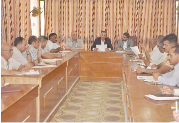
جانب من اجتماع دائرة زراعة الديوانية

واوضح ان الهدف من المتابعة هو تقليل ارتفاع الاسعار خاصة في نسبة التخميلات ، وان الهامش السعري كبير في علاوي بيع الجملة . واكدت الوزارة متابعة الجهات ذات العلاقة لاسعار المحاصيل الزراعية في علاوي بيع الجملة وذلك لضمان استقرارها وحماية المنتج المحلي وبما يخدم المواطن . وأشار الجبوري إلى حث وزارة الداخلية وإمانة بغداد وبلديات المحافظات إلى متابعة موضوع اسعار السلع الزراعية من خلال الهوامش والتخميلات الارية في الأسواق وعلاوي بيع الجملة في العراق وممثلين عن وزارة الصحة والبيئة وقيادة الأطباء وعدد من اساتذة الجامعات ونوي الاختصاص .