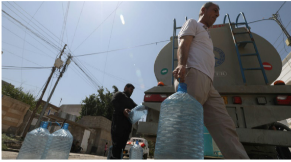
أربيل - الزمان

توقعت الهيئة العامة للأمناء الجوية والرصد الزلزالي التابعة لوزارة النقل، إن يكون طقس اليوم الثلاثاء صحو حاراً. وقالت الهيئة إن طقس اليوم الثلاثاء سيكون صحو حاراً، ودرجات الحرارة ترتفع عن اليوم السابق وتلامس 50 مئوية في مناطق الجنوب). وأضافت إن (تسعة محافظات في مقدمتها البصرة، تسجل أعلى درجات الحرارة على مستوى العالم). ويتنظر أهالي مدينة أربيل وضواحيها، صهاريج مياه لتعبئة خزاناتهم الفارغة، على وقع أزمة شح مياه تتكرر منذ سنوات خلال فصل الصيف. وقال مواطنون إنه (لا يوجد ما هو أسوأ من عدم توفر المياه خلال الصيف، ولا حياة من دون مياه)، وأضافوا إن (أغلب المناطق أصبحت تعتمد المياه الجوفية لتأمين حاجتهم من الماء، لكنهم منذ سنوات، باتوا يخشون أيام الصيف لمعرفتهم أنها ستأتي بأيام قاسية على وقع الجفاف الذي يضرب العراق منذ سنوات وقلّة الأبار والانقطاع المتكرر للتيار الكهربائي الضروري لضخ المياه)، وأوضح المواطنون (إنيهم يسعون إلى شراء المياه أو ينتظرون كميات المياه التي تؤمنها المنظمات الإنسانية للغسيل والاستحمام والطبخ