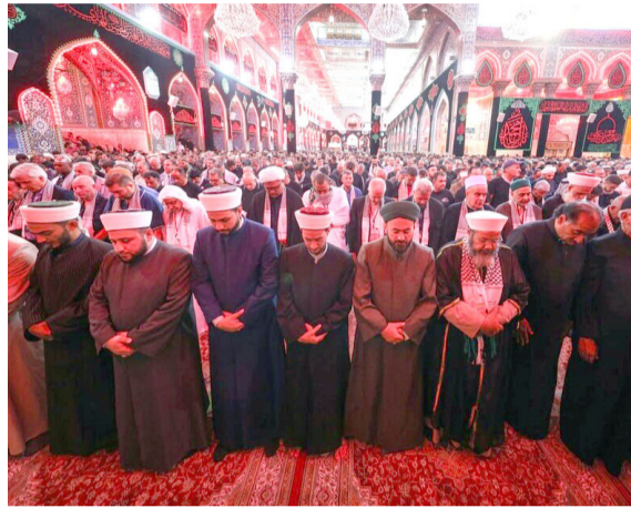
صلاة : رجال دين من مختلف المكونات يؤدون صلاة في كربلاء

توقعت الهيئة العامة للأمناء الجوية والرصد الزلزالي التابعة لوزارة النقل، إن يكون طقس اليوم الثلاثاء صحو حاراً. وقالت الهيئة إن طقس اليوم الثلاثاء سيكون صحو حاراً، ودرجات الحرارة ترتفع عن اليوم السابق وتلامس 50 مئوية في مناطق الجنوب). وأضافت إن (تسعة محافظات في مقدمتها البصرة، تسجل أعلى درجات الحرارة على مستوى العالم). ويتنظر أهالي مدينة أربيل وضواحيها، صهاريج مياه لتعبئة خزاناتهم الفارغة، على وقع أزمة شح مياه تتكرر منذ سنوات خلال فصل الصيف. وقال مواطنون إنه (لا يوجد ما هو أسوأ من عدم توفر المياه خلال الصيف، ولا حياة من دون مياه)، وأضافوا إن (أغلب المناطق أصبحت تعتمد المياه الجوفية لتأمين حاجتهم من الماء، لكنهم منذ سنوات، باتوا يخشون أيام الصيف لمعرفتهم أنها ستأتي بأيام قاسية على وقع الجفاف الذي يضرب العراق منذ سنوات وقلّة الأبار والانقطاع المتكرر للتيار الكهربائي الضروري لضخ المياه)، وأوضح المواطنون (إنيهم يسعون إلى شراء المياه أو ينتظرون كميات المياه التي تؤمنها المنظمات الإنسانية للغسيل والاستحمام والطبخ