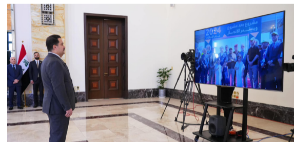
افتتاح : رئيس الوزراء يشرف على افتتاح مشاريع خدمية في بغداد

مبتاعة ملف أتمتة البطاقة التومبينة. وأوضح البيان إن (الاجتماع ناقش ملف أتمتة البطاقة التومبينة). على صعيد متصل، التقى السوداني، السفير الإيطالي لدى العراق ماوريتزيو غريغانتسي، بمناسبة انتهاء مهام عمله، وأشار البيان أن (النقاء بحث مجمل العلاقات بين البلدين، والعمل على تعزيزها وتتميتها في مختلف القطاعات، وبما يخدم المصالح المشتركة للعراق وإيطاليا). وأكد السوداني أن (الحكومة مهمة بالافتتاح على التعاون مع الشركات الإيطالية، وأنها عملت على تقديم جميع التسهيلات أمام عمل الشركات المختصة)، مشيراً إلى (حاجة العراق للخدمات التي تمتلكها إيطاليا في جميع المجالات).