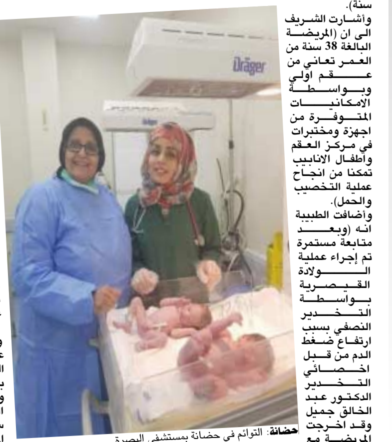
حضانة: التوأم في حضنة بمستشفى البصرة

الوليدن الى ردهة النسائية وهم بصحة جيدة). في السياق نفسه أعلنت دائرة صحة ديالى، ان مستشفى خاتقن العام اجرت عملية ولادة قيصرية نادرة لاسرة تمتلك رحم مزدوج وعنق رحمين. وقال مدير اعلام صحة ديالى فارس العزراوي لـ (الزمان) ، ان (مستشفى خاتقن العام شهدت اجراء عملية ولادة قيصرية ناجحة ونادرة من النوع الخاص لأسرة تمتلك رحم مزدوج وعنق رحمين). وأضاف