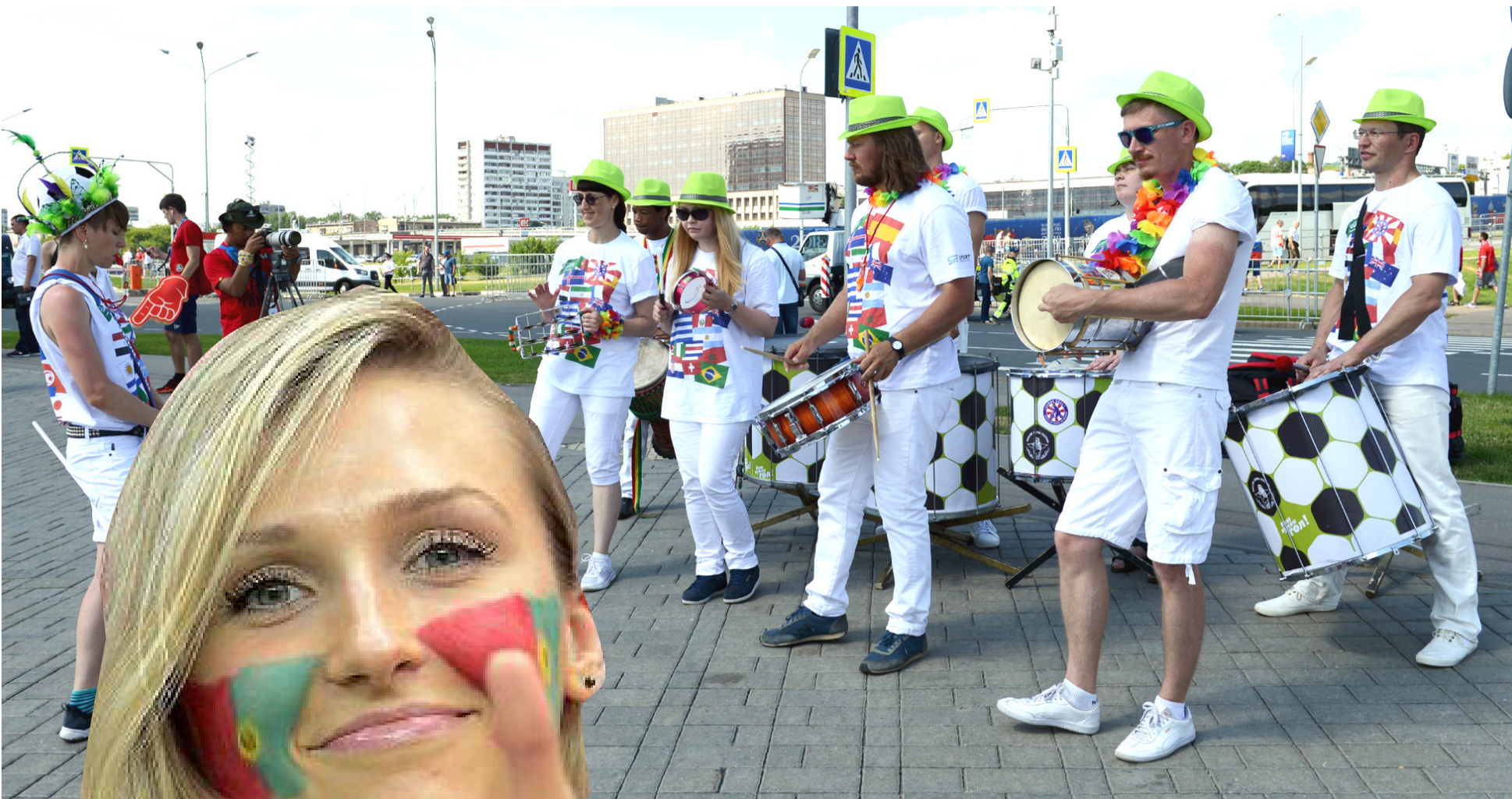
فنون : فعالية موسيقية على هامش مباريات كأس العالم