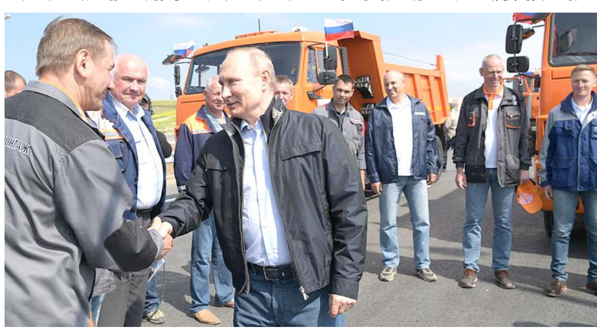
جسر: الرئيس الروسي فلاديمير بوتين يصافح مستقبليه على أطراف الآخر من الجسر

ويبلغ ارتفاع الجسر الذي يمر بجزيرة توتولا 35 متراً عند قوسه المركزي وستكون السرعة القصوى المسموح بها عليه 120 كلم في الساعة، إذا لم تؤد الظروف الجوية إلى إبطاء حركة السير