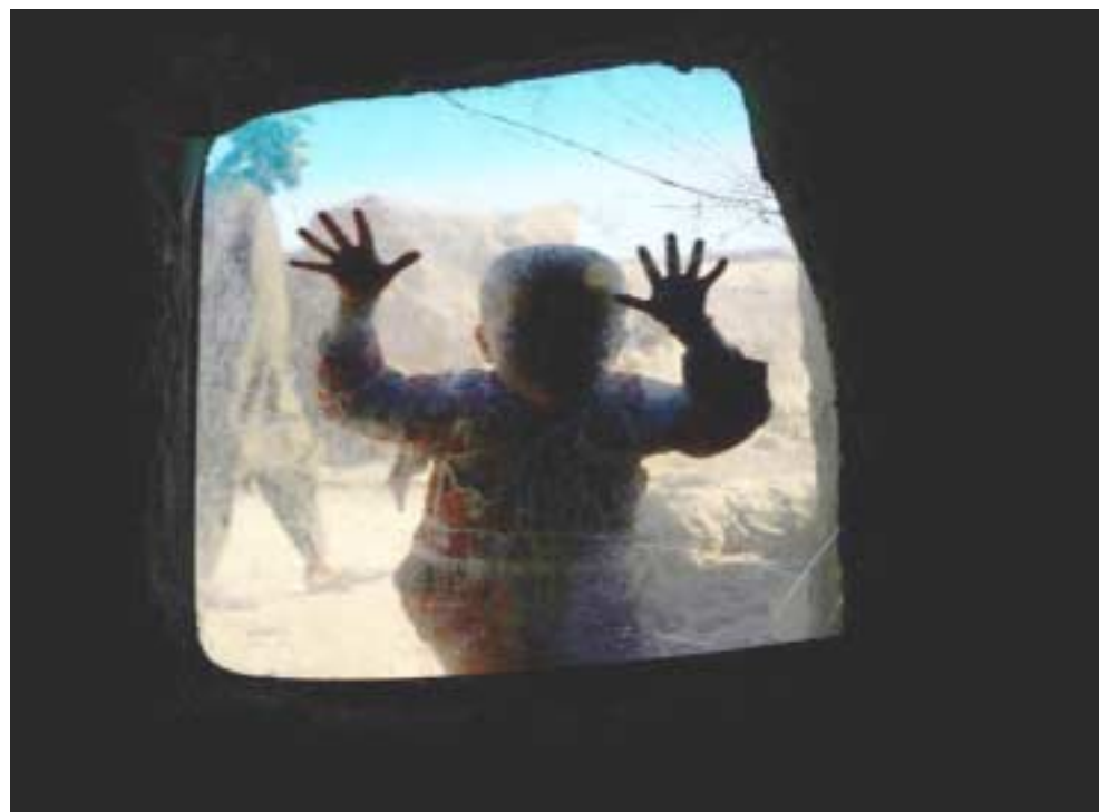
مخيم، للاجئين افغانى في مخيم على مشارف هرات

تشرين الاول/اكتوبر 2017 في الولايات المتحدة، وتقول المعارضة الديموقراطية التي تدعى غيباب الشغافية حول هذه القضية، ان عددا من كهن العائلات جاء لطلب اللجوء. منذ مطلع ايار/مايو بعدما اعلن وزير العدل جيف سيشنيز ان كل فكرة فصل الاولاد عن اهاليهم الذين يحاولون دخول البلاد، الا ان الاشارة اقربت بان حملة الفقم التي تطال العائلات يمكن ان تشكل رادعا. وتعيش عائلات من المهاجرين في معظمها من العنف المزمن في امريكا الوسطى وقد تفرق اقرباها منذ اجراء ابريل/مايو 2016، وبموجب القرار، يجب على اللاجئين الذين يأتون من بلدان مثل العراق والصومال والسودان وجمهورية الكونغو الديموقراطية وغيرها. وفي حين احببا الفلسطينيون هذه السنة الذكرى السبعين لتكسية عن قيام دولة إسرائيل، لا يزال هناك 4.5 ملايين لاجئ فلسطيني، حسب التقرير.