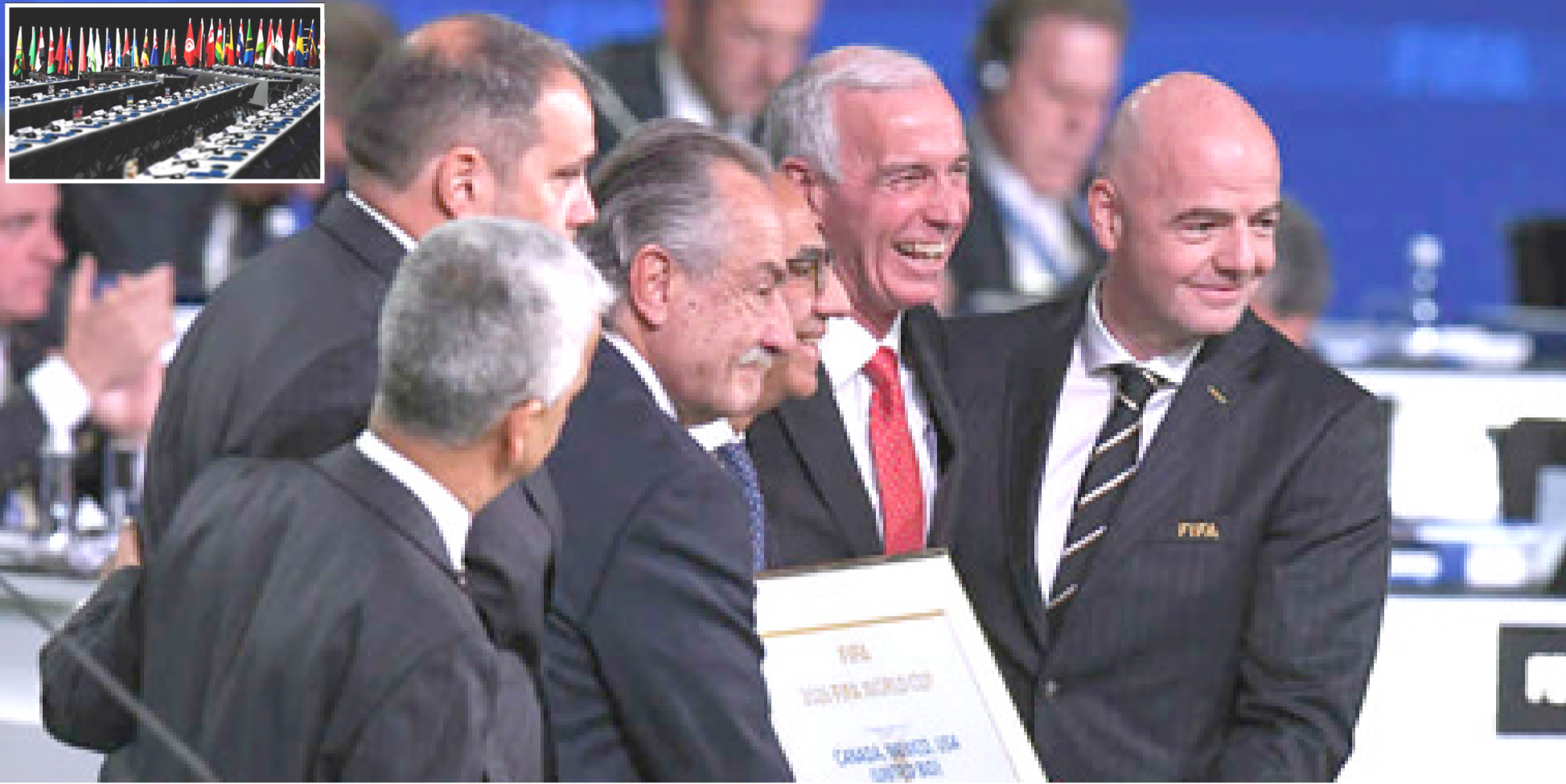
تصويت: الجمعية العمومية لفيفا تختار الملغ الثلاثي لتنظيم مونديال 2026 على حساب المغرب