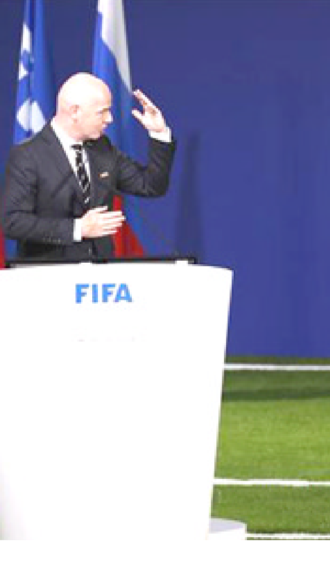
رئيس فيفا يشدد على ضرورة محاربة الفساد في إجتمع الكونغرس بروسيا

اس على خلفية توقيعيه لريال مدريد دون علمه. وسخر ماريو باسار، نجم المنتخب الإسباني السابق، من إسالة المدرب جوليبي صحفياً مساء امس، للحديث بشأن المدير الفني الجديد. يذكر أن لويس روبياليس، رئيس الإتحاد الإسباني لكرة القدم، أقال لوبيتيجي صباح اليوم والتي ستنتقل اليوم الخميس، وسيلعب الماتادور أمام البرتغال يوم غد الجمعة المقبل. وأضاف أن رئيس الإتحاد الإسباني عقد مؤتمراً بلاه خلفاً لمواطنه جولين لوبيتيجي، وأعلن الموقع الرسمي للمنتخب الإسباني، أن هيريو، سيقود المنتخب في بطولة كأس العالم 2018