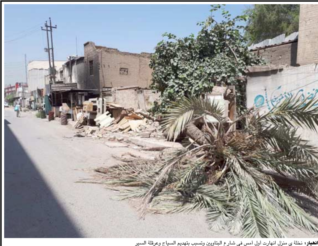
انفجار، نخلة في منزل انفارت أول امس في شارع البتاويين وتسبب بتهديم السياح وعرقلة السير

سليمة لبناء المؤسسات موضح (التطبيق). مبينا ان (الدائرة عملت على تشكيل هذه اللجان لدعم الصحة من اجل تقليل حالات الاعتداء على الملاكات الطبية. العمل من اجل حلها وتذليلها)