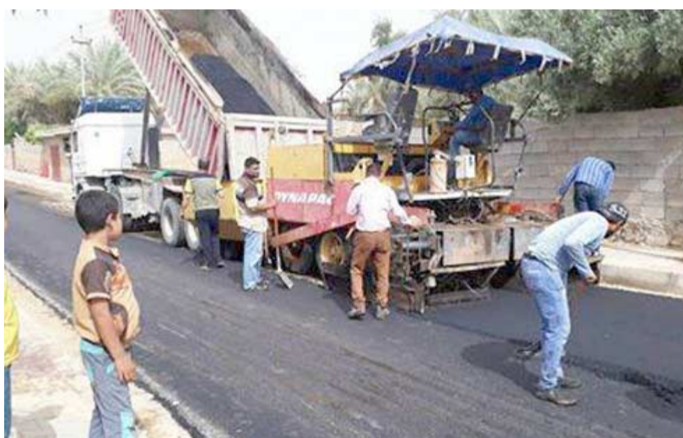
شوارع؛ عمال يؤهلون شوارع مدينة النجف

بغداد- الزمان وبشرت وزارة الأعمار والإسكان والشوارع والأشغال العامة تنفيذ اعمال إعادة تاهيل وصيانة ثلاثة شوارع رئيسية في مركز محافظة النجف، فيما تواصل الوزارة تنفيذ