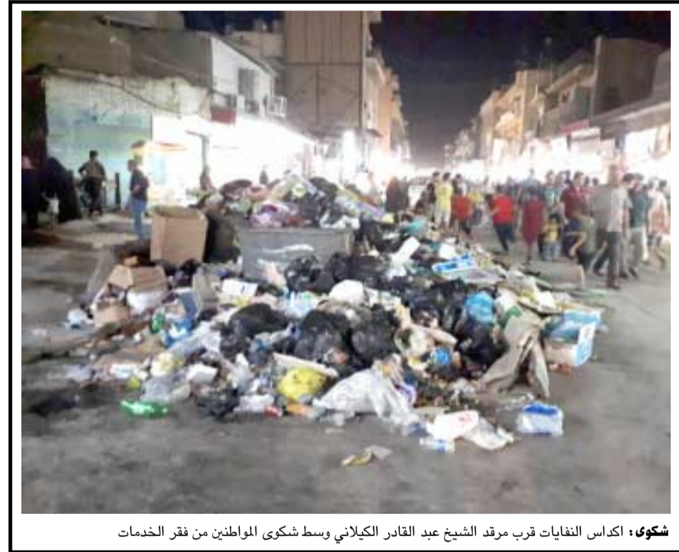
شوكى : اكداس النفايات قرب مرقد الشيخ عبد القادر الكيلاني وسط شوكى المواطنين من فقر الخدمات