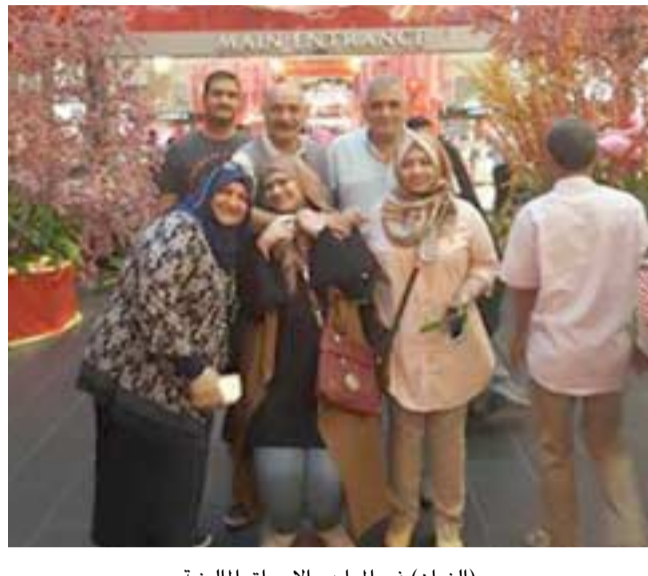
(الزمان) في المعابد والاسواق الماليزية