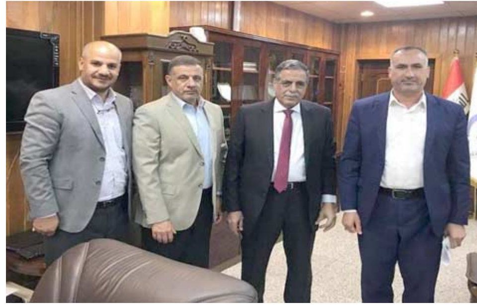
وزير الكهرباء خلال لقائه وفد محافظ ديالى

عرض مشكلة كهرباء محافظة ديالى بكامل تفاصيلها في الوزارة، حيث تعهد الوزير بتزويد المحافظة ب100 ميكاواط من حصتها خلال 48 ساعة كمرحلة اولية، فيما سيتم تخصيص حصة اخرى بعد افتتاح محطة بسماية منتصف الشهر المقبل). ووضح التميمي، انه (على الحكومة الاتحادية التدخل وإيجاد مخرج لإتقان ديالى ما تعانيه بسبب أزمة الكهرباء خصوصا بعدما تسببت بتوقف محطات مياه)، مشددا على (ضرورة استمرار التواصل مع الحكومة الاتحادية للوصول الى حلول). وبين التميمي، الى ان (المحافظة لم