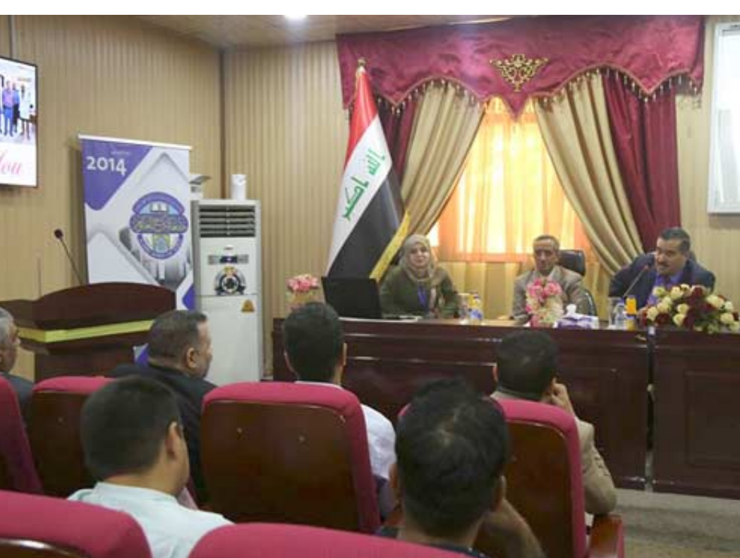
ندوة: المشاركون في ندوة إدارة المخاطر خلال جلسة الافتتاح

السرطان والوراثة الطبية بالجامعة المستنصرية، ندوة علمية عن العلاج الكيميائي لمرض السرطان، بمشاركة عدد من الأطباء والباحثين وطلبة الدراسات العليا وتابعت البيان ان ( محاضرة