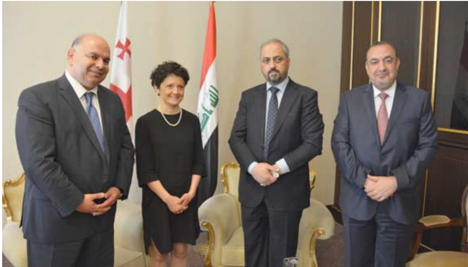
وفد وزير العدل ونظيرته الجورجية والوفد المرافق لها في بغداد

بغداد- الزمان استقبل وزير العدل حيدر الزمانلي نظيرته الجورجية تيبا تسولوكيان خلال زيارتها الى بغداد برفقة سفير جورجيا جريجوري طاباطازنه والوفد المرافق لها. وقال بيان تلقته (الزمان) عبر الفايبر امس انه (تم خلال الاجتماع المشترك مناقشة آفاق التعاون بين وزارتي العدل في البلدين ولكل ما من شأنه تسهيل الإجراءات لجاليتي البلدين ولا سيما مع وجود عدد كبير من الطلبة العراقيين في جورجيا وكيفية تقديم المساعدة القانونية لهم). وأضاف انه (تمت مناقشة الأوضاع في العراق ما بعد اعلان النصر على داعش الإرهابي وتحسن الوضع الأمني والاتجاه لإعادةعمار المناطق المتضررة وامكانية الاستفادة من تجربة جورجيا بعد انتهاء الحرب فيها وإعادة اعمار البلاد). وحسب البيان فقد اطلعت وزيرة على بعض حالات الجالية الجورجية في العراق ومتابعة قضاياهم القانونية.