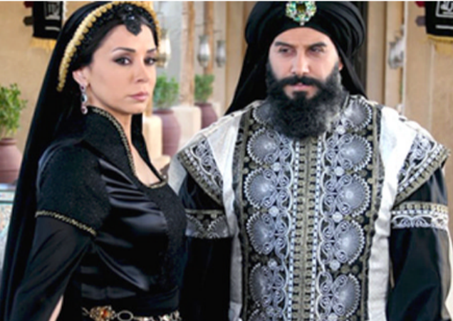
مشهد من مسلسل (هارون الرشيد)

بغداد - حمدي العطار إذا اعتبرنا النص الدرامي نوعاً من الأدب بحيث يعكس قراءته كرواية وقدرته على التأثير حتى لو لم يعكس تجسيده تمثيلاً كمالاً فهذا يعني ان النص الدرامي ناجح في كل الحالات لقوته وحسن صياغته. مسلسل (هارون الرشيد) الذي قدم للتلقيين لأكثر من مرة، لكننا في هذه المرة يتم تقديمه بمعالجة فنية جديدة وفيها عناصر الجذب من خلال الحوار الفلسفي والشخصيات وعلاقات عاطفية رومانسية متمعة بين مجموعة من الصدايا والشخصيات الأخرى التي تم اختيارها بعناية. الحلقات الأولى دائما تتناول خلافة الهادي ومحاوله منع ولي العهد اخيه (هارون الرشيد) وتولي ابن الخليفة (جعفر) ابن الهادي وهو الطفل بديلا كولي للعهد بدلا من