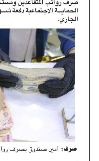
صرفاً: أمين صندوق يصرف رواتب المتقاعدين

بغداد - ابتغال العربي انجز مصرف الرافدين والرشد، صرف رواتب المتقاعدين ومستحقات الحماية الاجتماعية دفعة شهر آب الجاري.