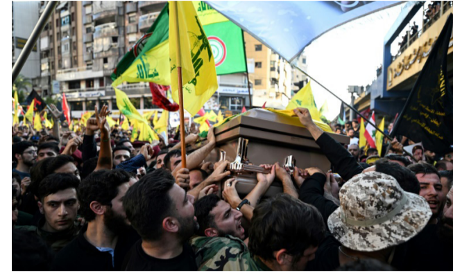
تشييع عناصر من حزب الله يحملون نعش القيادي فؤاد شكر خلال تشييعه في الضاحية الجنوبية لبيروت في الأول من الشهر الجاري

بيروت (ا ب ب) - بينما كان الإسم العام لحزب الله حسن نصرالله يتوعد إسرائيل برز حتمي على اغتيال أحد أبرز قاداته العسكريين، كان آلاف اللبنانيين يندفعون إلى وسط بيروت لحضور حفل استعراضي مبهر، في مشهد يجسد بلداً منقسماً أكثر من أي وقت مضى حول الحرب والسلام. وتقول أولغا فرحات (45 عاماً)، وهي ناشطة في مجال حقوق الإنسان غداة حضورها الحفل لوكالة فرانس برس «أحزن لرؤية الناس يموتون في جنوب لبنان وفي غزة، لكن المقاومة ليست في حمل بنديقية والقتال فحسب، الفرحة والفن والاحتفال بالحياة هو أيضاً شكل من أشكال المقاومة».