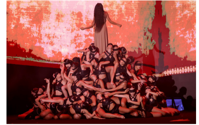
حفل فرقة مياس اللبنانية خلال تقديمها حفلاً استعراضياً في واجهة بيروت البحرية في الأول من الشهر الجاري

وتضيف «أنا من جيل نشأ وسط الحرب في لبنان وترعرعت في منزل يؤمن بالفضيلة الفلسطينية، لكنني أقول اليوم «لبنان أولاً»، وتوضح «إنسانياً، أنا مع الشعب الفلسطيني حتى أقصى الحدود، لكننا نعيّننا ونريد أن نعيش». وكانت فرحات في عداد قرابة ثمانية آلاف شخص تدفقوا مساء الخميس إلى واجهة بيروت البحرية لحضور حفل استعراضي راقص قدمته فرقة «مياس» اللبنانية، بعنوان «قومي» جسدت فيه الصراعات والوجع الذي تعيشه بيروت، وخصصت إحدى لوحاته لجنوب لبنان وأقيم الحفل الذي استهل بعرفقات نارية ضخمة زينت سماء العاصمة، بعد ساعات من تشييع حزب الله قائده عمليته في الجنوب فؤاد شكر، وتوعد نصرالله برز حتمي على إسرائيل التي يتبادل مقاتلوه القصف معها عبر الحدود اللبنانية منذ بدء الحرب في قطاع غزة في السابع من تشرين الأول/أكتوبر دعماً لحركة حماس. ويعد فرحات من مناصري حزب الله في قلب الضاحية الجنوبية، «الموت لأمرسكا» و«الموت لإسرائيل»، رافعة رايات الحزب الصفراء، في دعوة للانقسام بعد مقتل شكر، تمايل الآلاف في بيروت على بعد بضعة كيلومترات خلال حفل مياس، مرزديك لبيروت من قلبها سلام لبيروت، وقتل شكر بضربة إسرائيلية على حارة حريك ليل الثلاثاء أسفرت ذلك عن مقتل مستشار إيراني برفقة إضافة إلى خمسة مدنيين بينهم الطفلان الشقيقان أمير (6 سنوات) وحسن فضل الله (10 سنوات) وفي مقطع فيديو تداولته وسائل إعلام محلية، ظهرت وادة الطفلة التي التكني وهي تقول إن طفلها «فادك يا سيد»، في إشارة إلى نصرالله وتقول فرحات البحرية في الأول من الشهر الجاري