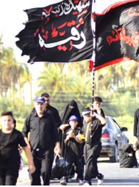
زوار: حشود زوار الأربعينية يتجهون صوب كربلاء