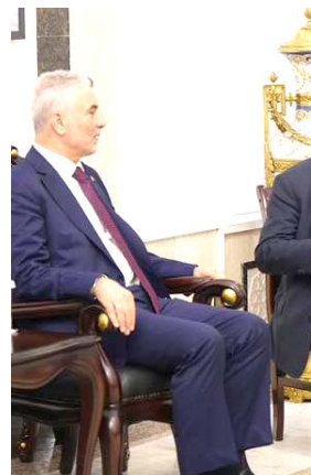
استقبال: رئيس الوزراء يستقبل وزير التجارة التركي

بكون نقطة تواصل، ومنطقة تنموية وشراكة لجميع دول الجوار). ومن جانبه، نقل بولات، (تحيات الجاد مع مشروع طريق التنمية)، ولفت الى (السياسة التي تتبناها الحكومة في تنمية العلاقات الاقتصادية، وأن العراق بما يمتلكه من موارد بشرية وطبيعية، قادر على أن