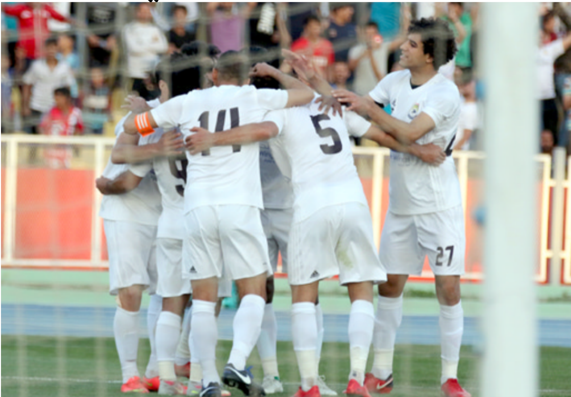
صدارة بيهاض؛ تحلق النوارس عالياً في صدارة النوري الممتاز بفارق عن الشرطة

متراجعا في سلم المرتب وسيمستقبل كبرلاء هذا الأسبوع بعد تسع خسارات ومثلها تعادل ويحتجأ إلى تعبير الاصور في هذه الاوقات التي اشتد فيها الصراع