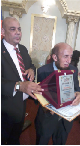
القاهرة - الزمان