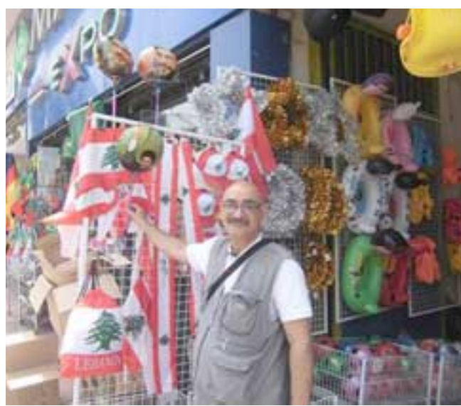
هدايا سياحية من وحي الانتخابات