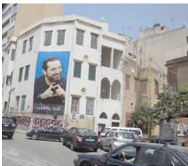
سعد الحريري ... بعلو مبنى