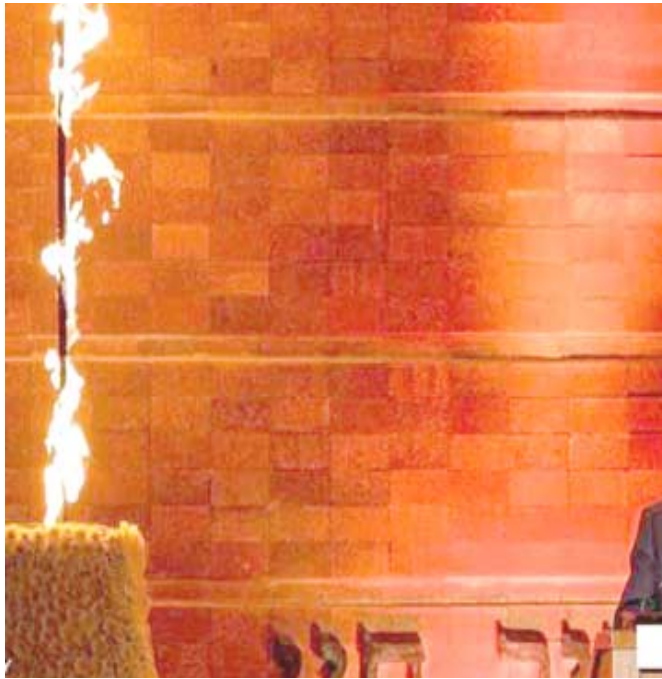
الحرق: الرئيس الإسرائيلي ريوفين ريفلين يلقي كلمة في نصب المحرقة

النazi، لكن لا يمكننا أن ننكر أن بولندا والبولنديين شاركوا في الإبادة. وتتهم المنظمة الرئيس الإسرائيلي الذي يدرس ويلاحق جرائم النازيين بأنه نسب إلى الشعب البولندي والدولة البولندية مسؤولية جرائم نازية، وهذا مخالف للقانون المتعلق بحرق اليهود. وكتبت في بيان نشر على صفحتها على الإنترنت أن العمل الذي قام به