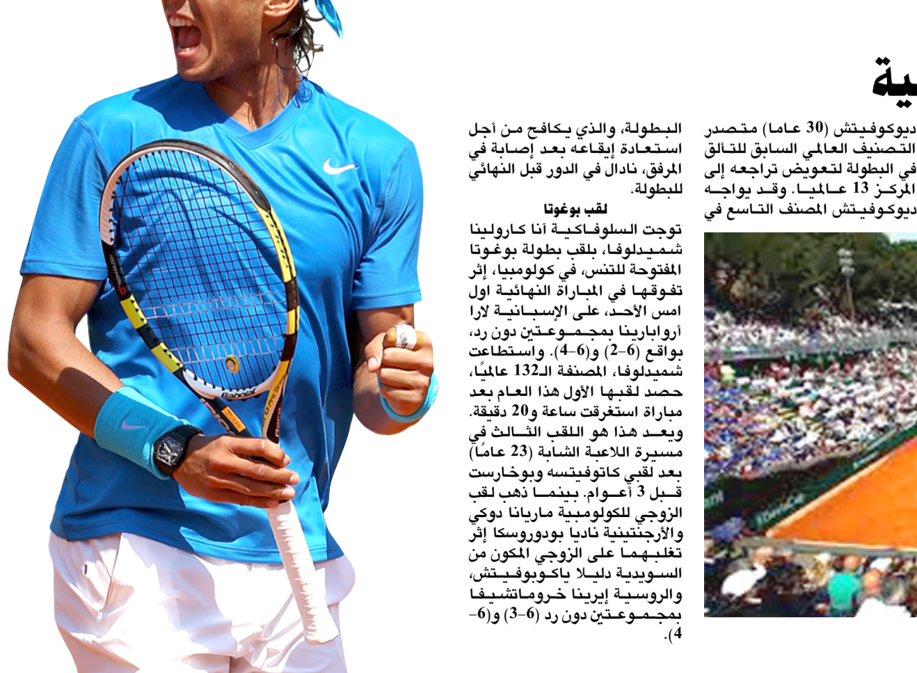
فرصة جديدة أمام نادال لتكرار إنجازاته في النش

□ الجزائر - وكالات: أعلنت وزارة الداخلية الجزائرية، أول أمس الأحد، عن تشكيل لجنة تحقيق في أحداث الشغب التي رافقت بعض مباريات مسابقة الدوري والكأس نهاية الأسبوع الماضي. وكانت المباراة التي تطلب فيها شبيبة القبائل على مولودية الجزائر الجمعة الماضية، بركلات الترجيح 4/4، بعد نهاية المباراة في الوقت الرسمي والأدواني بالتعادل السلبي، في الدور قبل النهائي لكأس الجزائر، شهدت أعمال شغب كبيرة أسفرت عن سقوط عشرات الجرحى وسط اشتعال الفريزين وعناصر الشرطة. فيما توقفت المباراة التي جمعت مولودية وهران بضيفه شباب بلوزداد ضمن الجولة 25 من مسابقة الدوري، في الدقيقة 79، بسبب احتياج مشجعي مولودية وهران للمربي، احتجاجا على تقدم شباب بلوزداد على فريقهم بهدفين. وتكررت وزارة الداخلية في بيان لها، أنه بعد الأحداث المؤسفة، التي شهدتها ملاعب كرة القدم في الفترة الأخيرة، وخاصة في المواجهتين بين شبيبة القبائل ومولودية الجزائر، ومولودية وهران وشباب بلوزداد، تقرر تشكيل لجنة تحقيق من أجل دراسة الأسباب التي أدت إلى حدوث تجاوزات خطيرة، وتحديد المسؤوليات، واتخاذ الإجراءات المناسبة لوضع حد لهذه الظاهرة العنصرية في المجتمع الجزائري. من جهة أخرى، تم إحالة ثمانية أشخاص إلى القضاء، من بين 79 شخصا جرى اعتقالهم، لكرة (بولك).