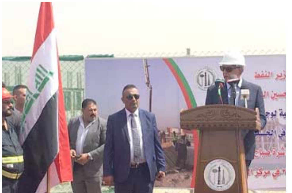
افتتاح: وزير النفط لدى افتتاحه محطة معالجة الغاز

واط ونقل بيسان لوزارة النفط تلقته (الزمان) اس عن وزيرها جبار اللعبيي قوله إنه (تم امس افتتاح محطة معالجة الغاز (كميات الغاز التي ستستخم معالجتها ستستخدمها لتشغيل الوحدات والمنشآت الانتاجية في الحقول النفطية) مشيراً إلى ان