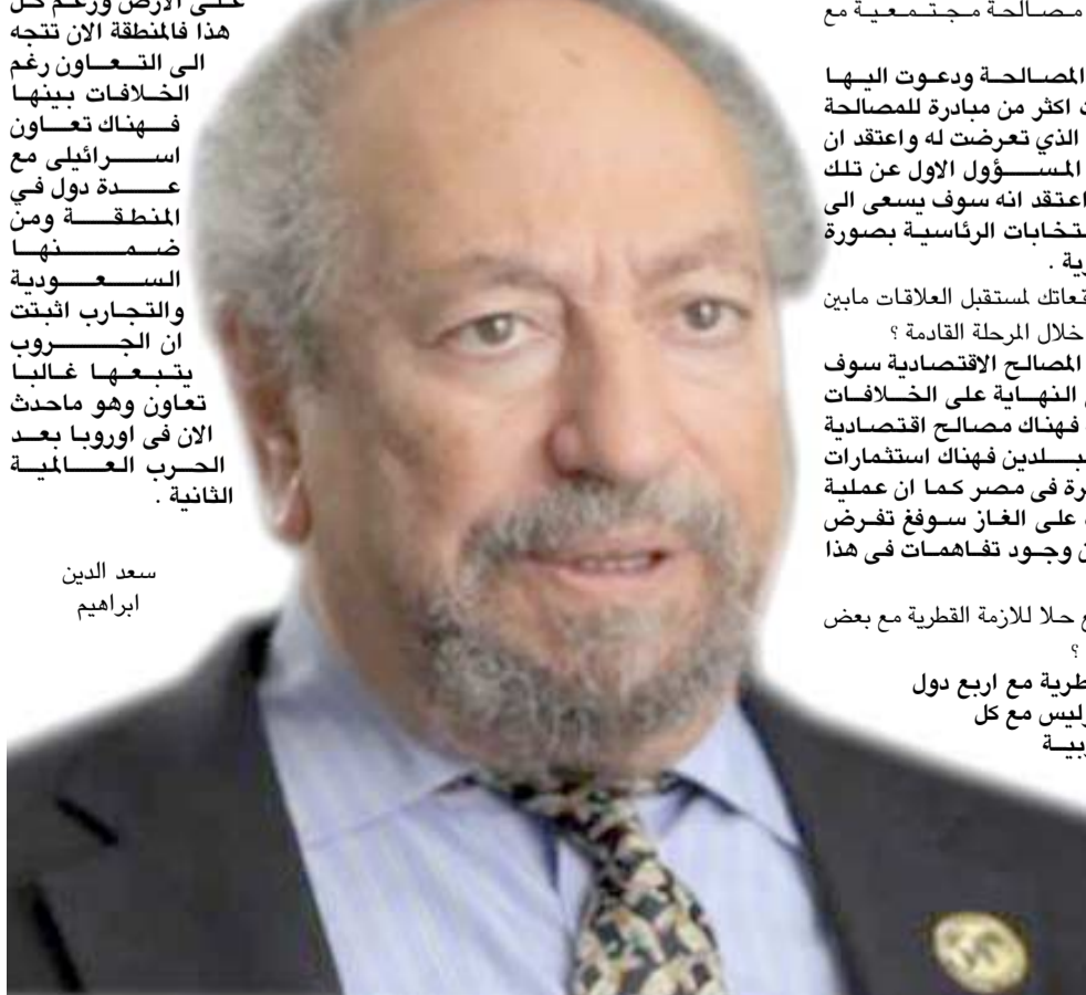
سعد الدين ابراهيم