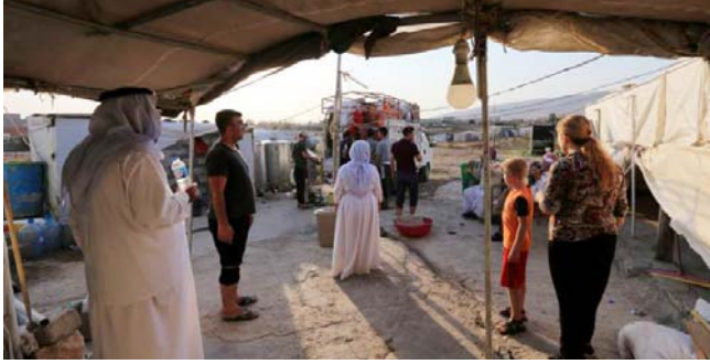
مخيم ازيديين في مخيم بدهوك