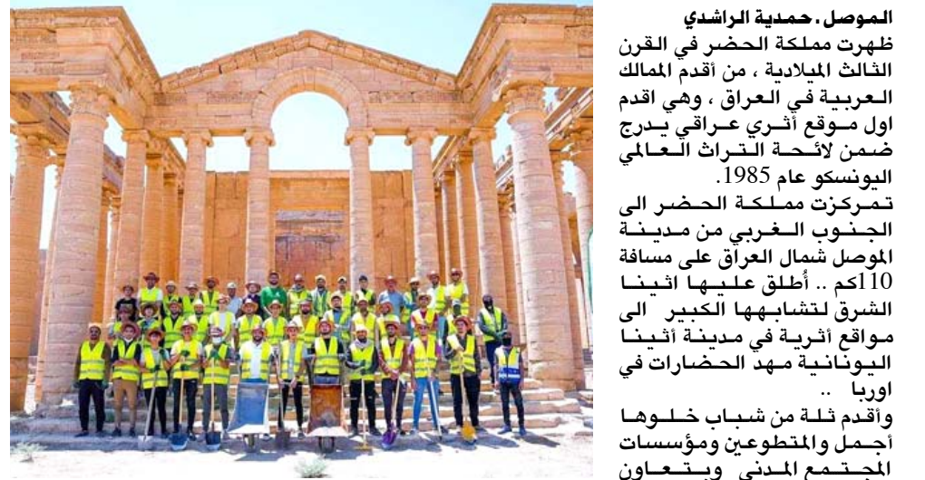
تظوع : شباب متطوعون في مدينة الحضر الأثرية

ينبؤي بهذا الإنجاز التاريخي الكبير في حديقة الشهداء بأيمن الموصل .. وتخلل الاحتفال أكثر من 50 بازاراً وإمسية غنائية وجلسات حوارية ومشاهدة الحضر الأثرية من خلال تقنية الواقع الافتراضي الذي يادري به شركة قاف لاب، هذا بالإضافة جناح خاص للمكتبات وسباقات وهديايا كثيرة