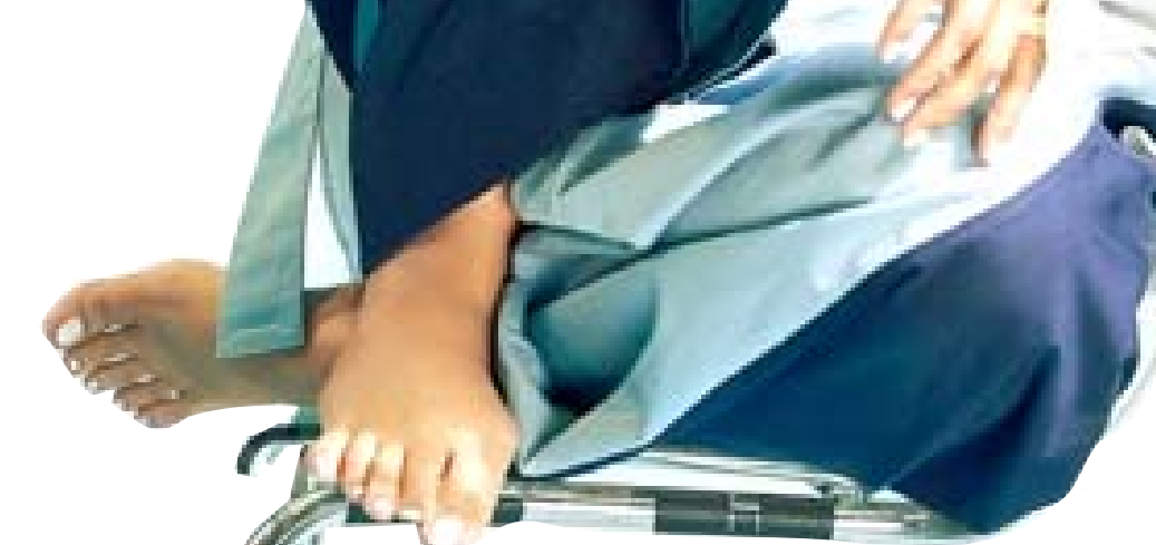
ياسمين عبد العزيز

القاهرة - الزمان رد الفنان شريف منير على الهجوم الذي تعرضت له ابنته اسما بعد حلاقة شعرها كاملاً، في مقطع فيديو ونشر منير مقطع فيديو عبر حسابه على (انستغرام) قال فيه: (مساء الخير، يأكل سمك مشوي ووز ابيض، إيه الدوشة اللي إنتو عاملينها دي وإيه الضجة اللي أنتو عاملينها دي، كل ده عشان بنتي قصت شعرها قدام الكاميرا إيه الغلط اللي هي عملته). واستكمل: (تصرف عادي جداً مفهوش أي حاجة، إوعوا تفكروا إني هاجي على بنتي عشان خاطر أكسب رضاكم.. دي بنتي اللي ماليش غيرها وبحبها). و اختتم: (اسما أنتي شكك زي القمر وشكك حلو جداً وحتدي التريند برافو عليكي، متمسعين كلام حد ومتهميش بكلام حد وأنا مش مهمت بالكلام اللي يتقال علياً ولا عليها، المهم إننا مش بنضرد حد، سلام عليكم). وكانت اسما شريف منير، قد نشرت فيديو جديداً لها عبر (انستغرام)، ظهرت فيه وهي تحلق شعرها بماكينه حلاقة، مما أثار الجدل ودمشة عدد كبير من المتابعين. وعلقت قائلة: (شعري بقاله فترة يقع جامد، ده غير ان من كثر العماليات اتحرق و بقي مش صحي خالص، غير الغد وتابئرها عليه، قررت انفذ قرار كان بقالي كتير اوي نفسي اخده، ابدأ من جديد، احذر نفسي، افتح صفحة جديدة، حقيقي هو قرار صعب جداً بس حسنتي بقوة و تغافل..).