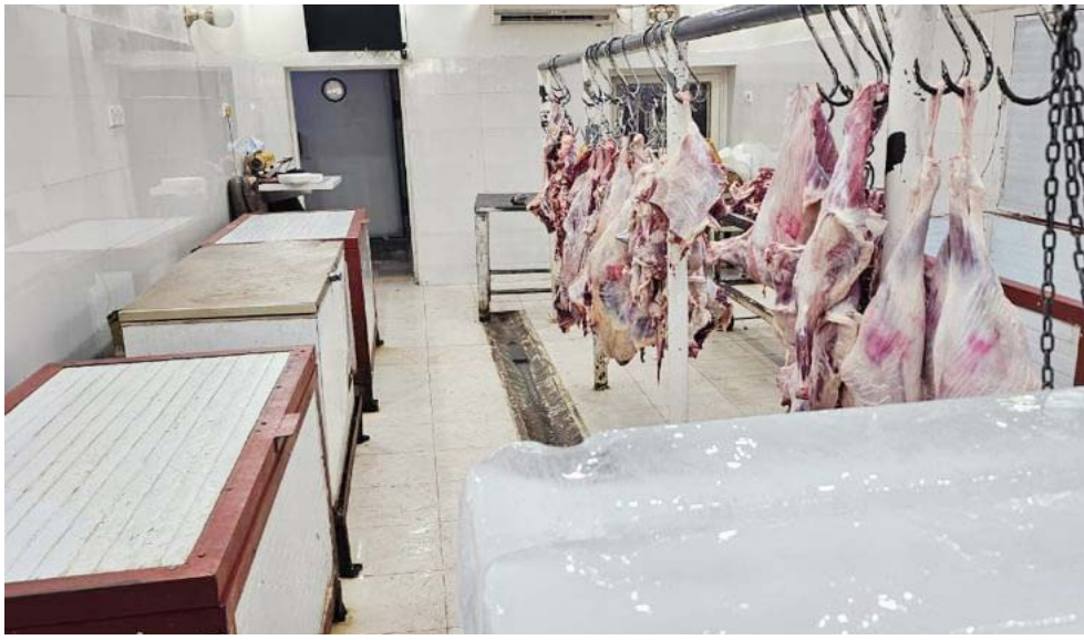
مخزن اللحوم التي تم ضبطها التي كانت معدة للتصدير

تقديم دراسة جدوى للمشاركة المقترحة والاستثمارية، والنظر بتوصيات لجنة الخطة بشأن توزيع حصص الماطح والحالات الخاصة في المناطق البعيدة عن مراكز المدن او المحافظة). على صعيد متصل، وقع رئيس اتحاد الغرف التجارية، عبد الزراق الزهيري، مذكرة تفاهم مع نظيره الماليزي.