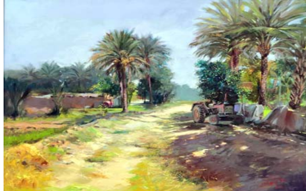
فن الرسم: لوحات بريشة صلاح هادي