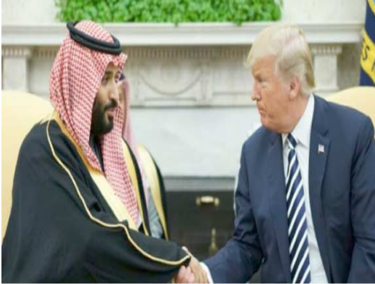
استقبال الرئيس الأميركي دونالد ترامب مستقبلا ولي العهد السعودي الأمير محمد بن سلمان في البيت الأبيض

ولم يتضح ما إذا كان أحد في موقف الأوتوستوب المخصص للركوب الحياتي، ومثل هذه المواقف منتشرة في إسرائيل وقرب المستوطنات في الضفة الغربية المحتلة بعد الاصطدام، حاول السائق الفرار سيرا وأطلق عليه جنود في المنطقة النار، بحسب الجيش. ولم يذكر بيان الجيش تفاصيل حول هوية السائق، لكن وكالة الأنباء الفلسطينية (وفا) ذكرت إنه عربي إسرائيلي نفذ فلسطينيون ومن عرب إسرائيل هجمات بسيارات استهدفت إسرائيليين. لكن قوات الأمن الإسرائيلية واجهت أيضا اتهامات باستخدام القوة المفرطة في بعض الحالات.