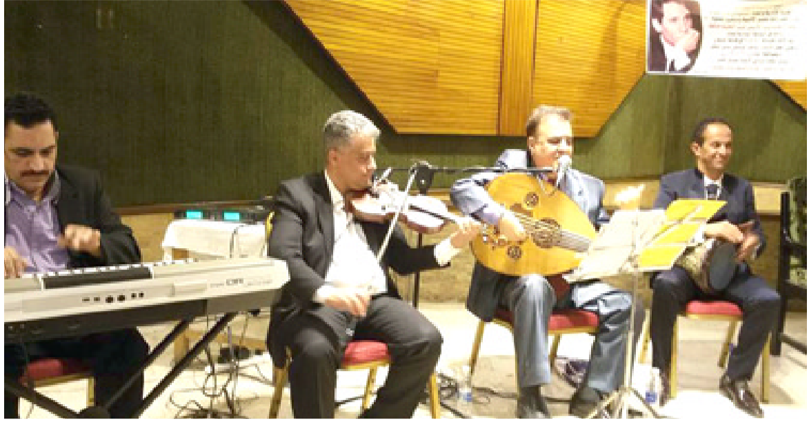
العندليب الأسمر: حفل إستذكار عبد الحلیم حافظ تضمن أغان بصوت جواد محسن

□ لوس أنجلوس - وكالات: غيب الموت الممثلة الأمريكية ديني لي كاريغتون الجيدة الماضية عن عمر ناهز 58 عاماً. فقد ولدت كاريغتون في 14 من شهر كانون الأول عام 1959 في سان خوسيه، كاليفورنيا، بالولايات المتحدة. قدمت الممثلة الراحلة التي تميزت بقصر قامتها (112 سنتيمتراً) مسيرة طويلة في عالم السينما والتلفزيون، وظهرت في العديد من الأفلام والمسلسلات والبرامج، وهي تعمل في التمثيل منذ كانت في العشرينيات، من أبرز أعمالها هوف، ورجال بين الأنشجار وعودة بامان وحرب النجوم والمسلسل الكوميدي سينفيلد، وهي حاصلة على شهادة في الطب النفسي للأطفال من جامعة كاليفورنيا.