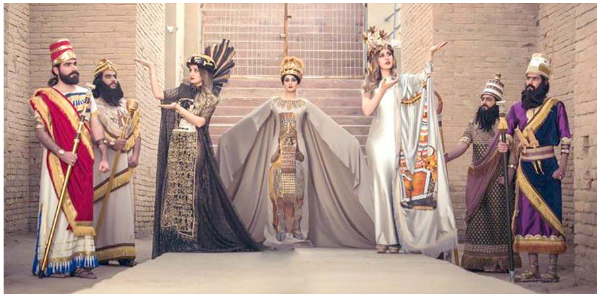
تخرج : طلبة من الجامعة المستنصرية في مشهد لتقليد رموز بابلية وأشورية خلال حفل تخرج بين جدران مدينة بابل الأثرية

أجرت وزارة التربية تعديلاً على جدول الامتحانات النهائية للساسس الإعدادي، مشيرة إلى أن ذلك جاء استجابة لمناشيرات الطلبة وعوائلهم وتقديراً لظروفهم الاستثنائية. وقال الوزير محمد اقبال في بيان امس انه (وجه بتغيير واعتماد جدول جديد للامتحانات لمرحلة الساسس الإعدادي تخديراً لظروفهم الاستثنائية)، وأضاف ان (ذلك جاء بعد مناقشات من طلبة الساسس بكافة فروعهم وعوائلهم)، مؤكداً (حرصه على دعم الطلبة وتوفير الاجواء المناسبة لاداء الامتحانات النهائية)، مشيراً الى ان (الامتحانات ستبدأ من تاريخ 21 حزيران المقبل وتنتهي يوم 21 من تموز المقبل، على ان يكون بين كل مادة وأخرى فاصل لا يقل عن يومين) ودعا اقبال الطلبة الى (الاستفادة من هذه الفرصة من أجل تحقيق النجاح المطلوب، باستثمار الوقت المتاح وبذل الجهود والطاقات لرفعة السجل وبنائه)، فيما كشفت الوزارة عن جدول 8 مدارس توزعت 3 منها في محافظة القادسية ومثلها في بابل والإخريتين وتوزعتا بين بغداد والرسافة / الأولى والحصرة حيث اذانت تلك المدارس حلة جديدة ضمن الحملة الوطنية لتبنيها اقبال (مدرستنا بيتنا) لترميم وتأهيل المباني المدرسية في المحافظات بهدف توفير بيئة تربوية مناسبة للطلبة. وقال بيان للوزارة امس ان تربية محافظة القادسية شهدت مدارسها الثلاث بنوخة نصر وفانوية النورين مع بنت الهدى وكذلك القادسية الابتدائية اعمال عدة تضمنت ترميم وإمالة النباتات بمقابلها المختلفة، اما في نظيرتها في بابل فقد كان هناك مدرسة الفورة و اشور والشعب والتعليم.