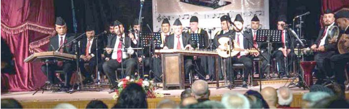
أمسية متميزة: فرقة المقام العراقي تقدم النغم الاصيل