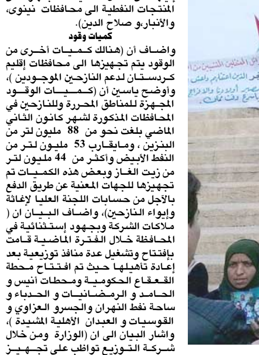
اعتقال، تظاهرة لذوي المعتقلين لدى تنظيم داعش

المنتجات النفطية الى محافظات نينوى، والأنبار والسليمانية.