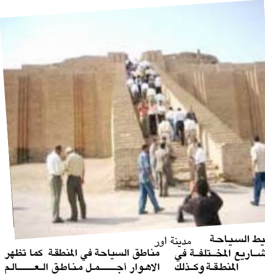
مدينة أور أو الإهورات الأثرية المختلفة في المنطقة كما تظهر

مناطق السياحة في المنطقة كما تظهر الإهورات الأثرية المختلفة في المنطقة