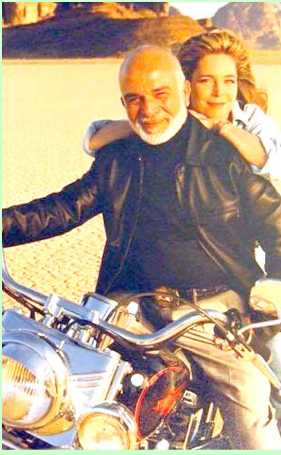
الملك حسين وعقليته

الملك عندما يحب أهله يكون قدوة لأبناء شعبه وغالبا ما يحرص على إعطاء صور للوفاء والانسجام العائلي لقطعة ولا أروع للراحل الملك الحسين رحمه الله والملكة نورا عقليته وهم يجسدون معاني الحب في أبهى صوره بعيدا عن السياسة وهمومها ومشاكلها فأخذها في رحلة استجمام على ظهر دراجته النارية بعيدا عن هموم السياسة فيما أظهرت الملكة وفاء قل نظيره لرب الأسرة الملكية وراعي البلاد الذي أفنى حياته من أجل أن يكون الأردن كما هو الآن بلد التطور والامن والأزدهار.