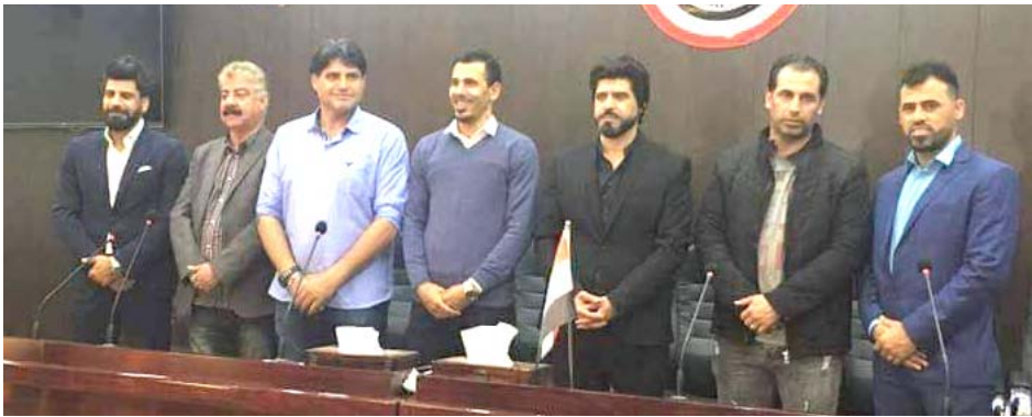
يونس محمود يتوسط لاعبين دوليين

بحضور أكثر من خمسين لاعبا دوليا سابقا من العراق في مختلف البطولات العربية الآسيوية والدولية جرت في مقر الاتحاد العراقي المركزي لكرة القدم انتخابات رابطة اللاعبين الدوليين السابقين في لاختيار ممثلا عنهم في الهيئة العامة للاتحاد العراقي وقبل إجراء الانتخابات انسحب النجم الدولي السابق نعيم صدام من المنافسة على رئاسة الرابطة لصالح النجم الدولي يونس محمود وبعدها جرت الانتخابات بإشراف أعضاء الاتحاد العراقي وبحضور مختلف وسائل الاعلام وأسفرت النتائج عن فوز النجم يونس محمود برئاسة الرابطة وتم اختيار النجم الدولي السابق وافي أسود نائبا للرئيس