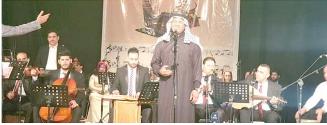
غناء ريفي، أصوات ريفية أصيلة شاركت في مهرجان ترنيمة الهور