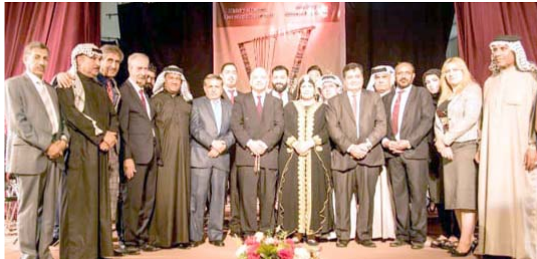
صورة تذكارية تم التقاطها في ختام المهرجان

وبعد ان قدمت المهرجان الغنائي الريفي واحفظت باهم اطوار الاغنية العراقية في الاعوام المنصرمة نجحت الدائرة العام الحالي باقامة امسية للمهرجان حضرها جمهور غفير استمع بروائع الغناء الريفي الذي انفرد به العراق بتقديم عشرات الاسماء الغنائية الريفية التي مازالت اصواتها تصدح في المهرجانات