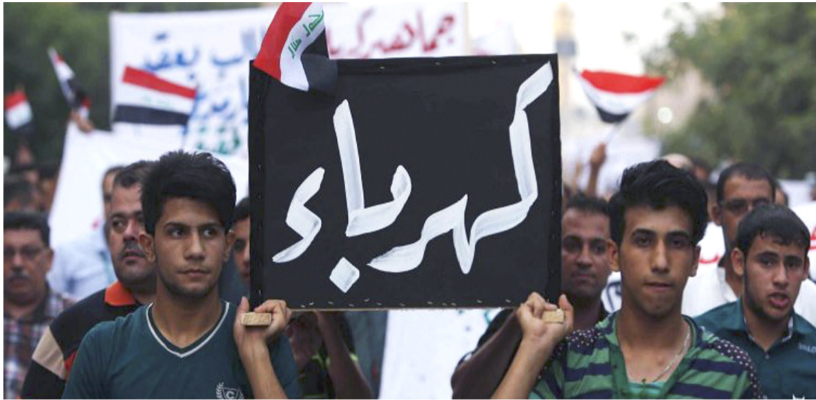
تشجيع : متظاهرون يشعرون الكهريا، في دلالة رمزية

ولن يشهد الوضع تحسناً ملموساً، ما لم تكن هناك جهود حقيقية ومستمرة، وداعمة من قبل الحكومة والقطاع الخاص، والمجتمع الدولي، والتي بدورها تعكس التزاماً جاداً بتحقيق الأهداف المنشودة.