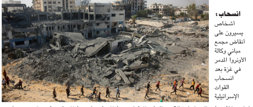
انحساح: أشخاص يسرون على انقاض مجمع مباني وكالة الأونروا المنمر في غزة بعد انسحاب القوات الإسرائيلية

بغداد - ابتهاج العربي محمل خبراء، السلطة التشريعية، مسؤولية الإغفال عن ادرج حدث وطني مهم لدى العراقيين ضمن قانون العطل الرسمية، الذي جرى التعديل عليه مؤخراً، فيما أشار إلى عدم تعطيل الدوام في ذكرى (الزمان) أمس إن (الأصل في تعطيل المصالح العامة في الدولة لا يجوز ومحرم ما لم يستثنى بقانون، ولضرورة الاحتفال بالذكرى السنوية الـ 75 لتأسيس حلف شمال الأطلسي التي أقيمت في العاصمة واشنطن، وانطلقت أعمال الاحتفال، بحضور الرئيس جوزيف بايند وبمشاركة زعماء 32 دولة ووزراء خارجية الدول. وقال البيان إن (حسين شارك في اجتماع رفيع المستوى ضمن قمة حلف شمال الأطلسي الثاني، حيث تبادل الآراء وجهات النظر بشأن التطورات الإقليمية والدولية والعلاقات الثنائية بين العراق والدول المعنية مع كل من نظيره الأمريكي أنتوني بلينكن ووزير الدفاع لويد أوستن، وكذلك وزراء خارجية السويد توبياس بيستروم والكويت عبد الله علي (الجيا).