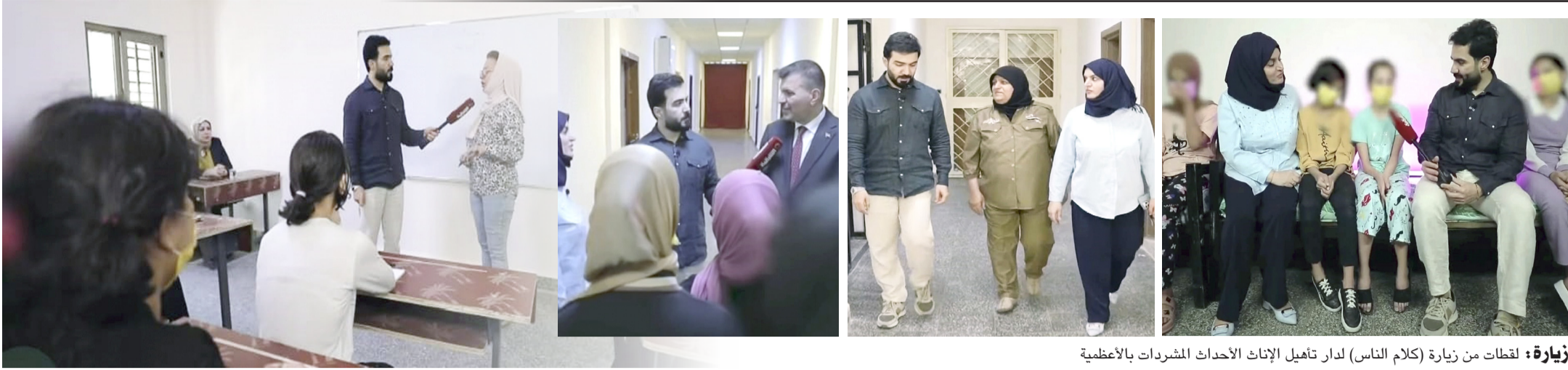
زيارة: لقطات من زيارة (كلام الناس) لدار تأهيل الإناث المشرذات بالأعظمية