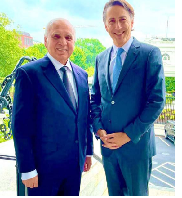
لقاء : وزير الخارجية يلتقي في واشنطن نائب وزير الخزانة الأمريكية

بغداد لإعادة العلاقات التي مجارها بين البلدين. وقال حسين في تصريح متلفز (العراق طرح مبادرة للتوسط بين أنقرة ودمشق، والتواصل مستمر في هذا المجال)، وأشار إلى إنه (التقى نظيره التركي حقان فيدان في واشنطن من أجل ترتيب لقاء في بغداد مع الجانب