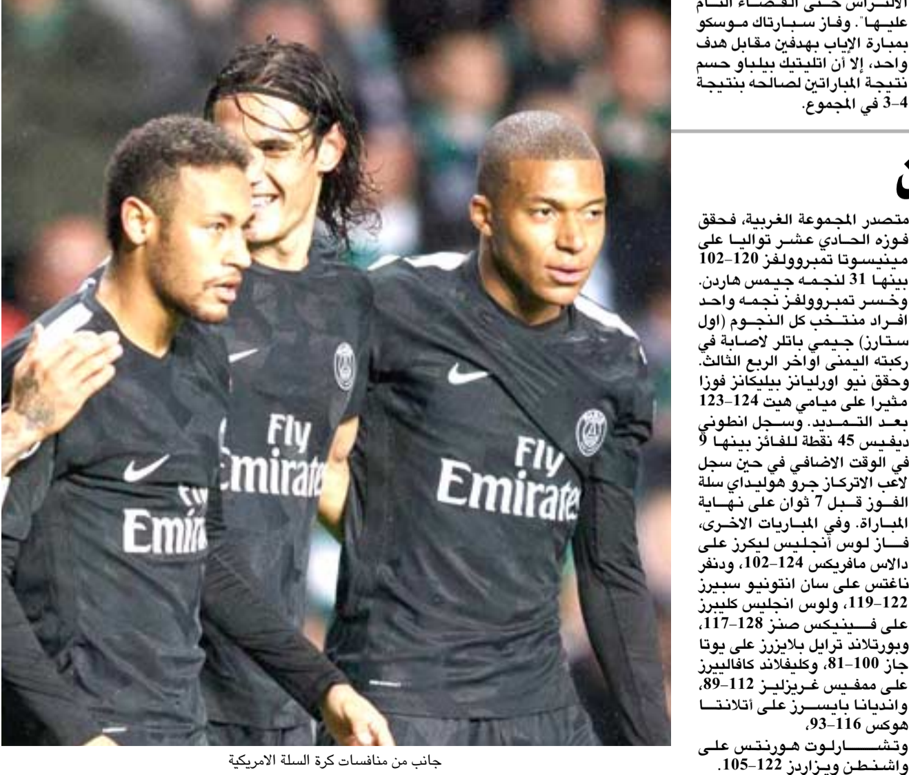
جانب من منافسات كرة السلة الأمريكية

مدن - وكالات أظهرت تقارير إعلامية فرنسية أن نجم باريس سان جيرمان، نيمار داسيلفا، هو اللاعب الأكثر تعرضاً للمخالفات من قبل الخصوم بالدوريات الخمس الكبرى هذا الموسم، اللاعب البرازيلي البالغ من العمر 26 عاماً، تصدر المشهد باقتراد ومعدل كبير، حيث يتعرض لمخالفة كل 17 دقيقة بالدوري المحلي ويمجموع مخالفات وصل إلى (96) منذ بداية الموسم. وسجل نيمار 20 هدفاً وصنع 13 خلال 19 مباراة بالدوري الفرنسي هذا الموسم. والقائمة تضمنت أكثر عشرة لاعبين