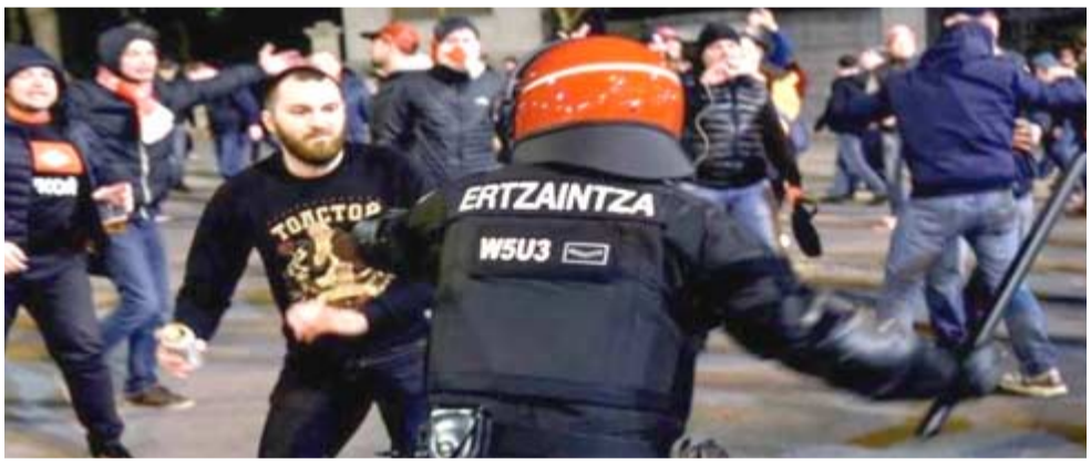
اشتباكات في الدوري الأوروبي

مدن - وكالات توفي شرطي إسباني جراء اشتباكات بين المشجعين قبل مباراة أتلتيك بيلباو وسبارتاك موسكو في الدوري الأوروبي. وأعلنت السلطات إن الشرطي من قوة شرطة إقليم الباسك التي تعرف بـ"إرتزينتزا"، وأنه توفي بمناسبة المباراة، وتقول التقارير نتيجة أزمة قلبية عند تدخله لوقف العنف بين جمهور الفريقين، ونشرت الشرطة أكثر من 500 فرد بمناسبة المباراة، وتقول التقارير كما قدم رئيس الوزراء الإسباني ماريانو راخوي تعازيه وادان أعمال العنف. وقال أعرب عن تقديره لإرتزينتزا ولجهودهم في حماية أولئك الذين يعرفون كيفية الاستمتاع بالرياضة. وأظهرت مقاطع فيديو وقوع اشتباكات عنيفة بين مشجعي الفريقين وكان كل منهما يطلق الألعاب النارية باتجاه الآخر في الشوارع، وادان الاتحاد الأوروبي لكرة القدم (يويفا) ما