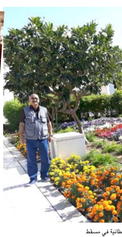
(الزمان) في دار الأوبرا السلطانية في مسقط