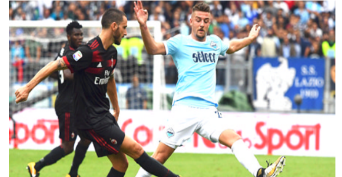
جانب من إحدى مباريات الدوري الإيطالي

□ روما - وكالات: وقع نادي إيه سي ميلان الإيطالي، عقداً للرعاية مع إحدى شركات الشهيرة للملابس والأوتار الرياضية لتجعله فريقاً من إيراد صفقة التعاقد مع أحد نجوم الدوري الألماني.