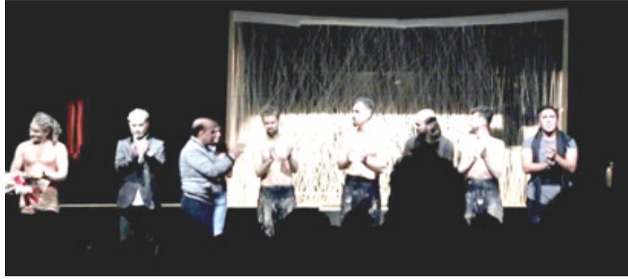
عمل متميز: (صفر سالب) على خشبة مهرجان قرطاج (الزمان)

دعيم يتميز بعمل ينتمي إلى فن خشبة الحديث: