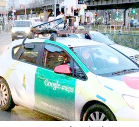
سيارة غوغل تجوب الشوارع

وتوصلت الدراسة أيضاً إلى أن السيارات الألمانية واليابانية (لكرس تحديداً) وجدت في مناطق ذات مستوى دخل أسري مرتفع. ويمكن لاستخدام نداء اصطناعي قوي لتحليل صور السيارات من خلال خدمة عرض الشوارع من غوغل أن يوفر طريقة أسرع وأرخص لتحديد المناطق التي قد تعاني من عدم المساواة بشكل أكبر من غيرها. فعلى سبيل المثال، هناك فوارق اقتصادية كبيرة في مستوى الدخل في مدينة شيكاغو، حيث توجد السيارات الرخيصة وتلك الأكثر كلفة في أماكن منفصلة عن بعضها في جميع أنحاء المدينة، بينما شهدت مدينة