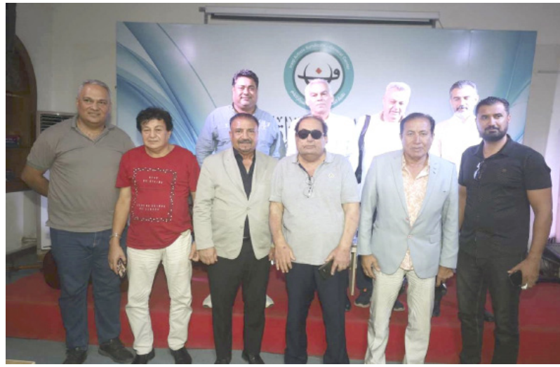
احتفاء: لقطات من جلسة الاحتفاء، بادر المولى