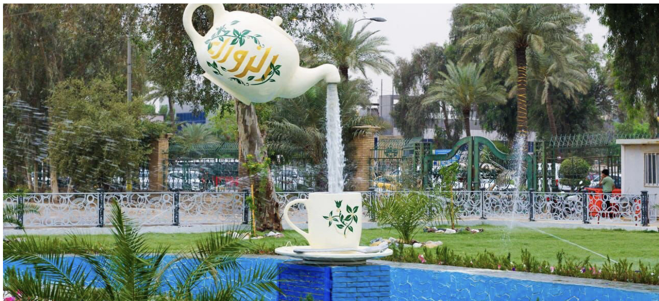
هدائق : احد مداخل منتزة الزوراء بعد اعادة تاهيله

حيث تجري توسعة وإضافة جسرات لطريق محمد القاسم، وتخطيط الطريق وإضافة خطين من الجانبين، فضلاً عن وضع إعلانات وإضاءة بطريقة حديثة جداً، وصيانة الجسر بالكامل، وتابع ان (شوارع الكرادة داخل مستأنف العمل به، اما الجانب الثاني فسيشهد أعمال كهرباء، إضافة اعمدة جديدة في المنتصف، كما يجري إنكسائه خلال الأسبوع الجاري، مع تطوير المنطقة من قاطع الأورزدي إلى النفق بالكامل)، وتستمر حملة بغداد اجمل، بمشاركة أعمال بلدية النورة في شارع الصحة، وذكر بيان امس ان (فرق امانة بغداد، انطلقت بأعمال الحملة منذ الأسبوع الماضي، بتابعة الوكيل البلدي للامانة، رزاق المعقوبي، وبمشاركة الملائمات المتقدمة من دوائر الامانة)، لافتاً الى ان الحملة تضمنت رسع الانقاص، كما يتم تسييجها وزراعتها بالأشجار، بهدف زيادة المساحات الخضراء ومكافحة التصحر، واطلع امين بغداد، عمار موسى، خلال جولة ميدانية على الاعمال النهائية لإنجاز مشروع تاهيل وترميم المحور الحادق لشوارع المتنبي المهتم من السوق السرياي حتى جامع وساحة السفير. ويصحب البيان فان (موسى نفقد مشروع صيانة المحور بالتعاون مع رابطة المصارف العراقية الخاصة، لافتتاحه قريبا امام المواطنين، كمركز